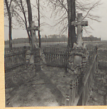
8. Nagrobki NN.