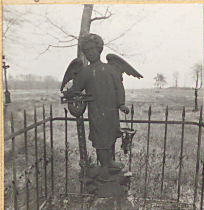
4. Postać anioła.