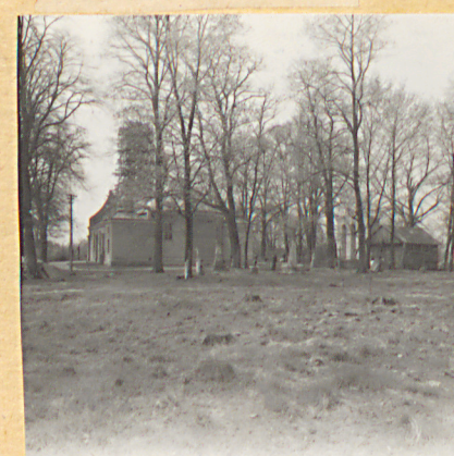
11. Widok ze starego cmentarza na kościół, od strony nowego cmentarza.