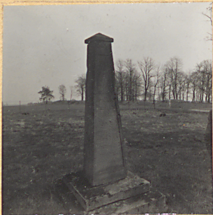
1. Nagrobek NN, klasycystycz-2. Nagrobek NN. ny 1849 /?/.