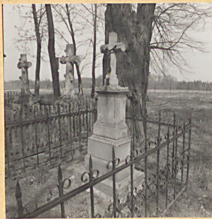
5. Nagrobek ks. Stanisława Sypniewskiego + 1892.