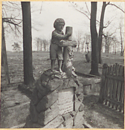
6. Nagrobek Stefana Wyżkowskiego + 15.VI.1909.