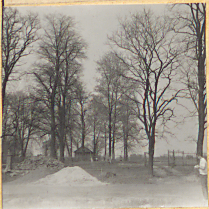
10. Widok z drogi.