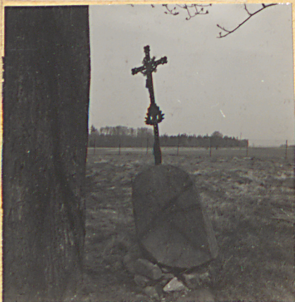
7. Krzyż NN.