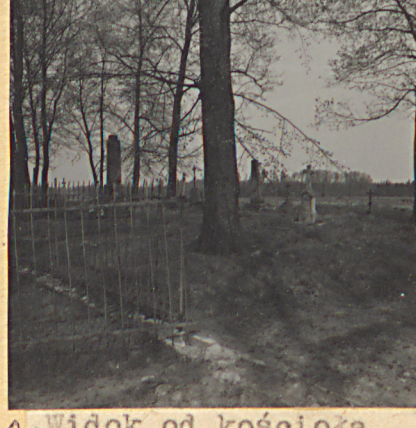
9. Widok od kościoła.