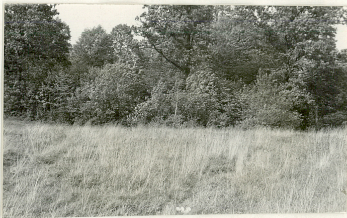
6. Widok od drogi