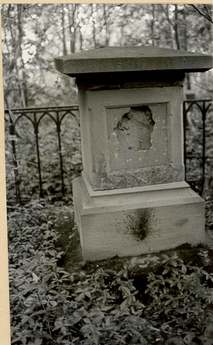
3. Zdewastowany nagrobek z ogrodzeniem met. z 1894r. /napisów brak/