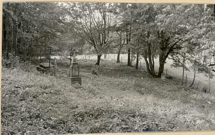
4. Widok ogólny