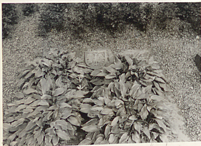
7. Mogiły żołnierzy polskich