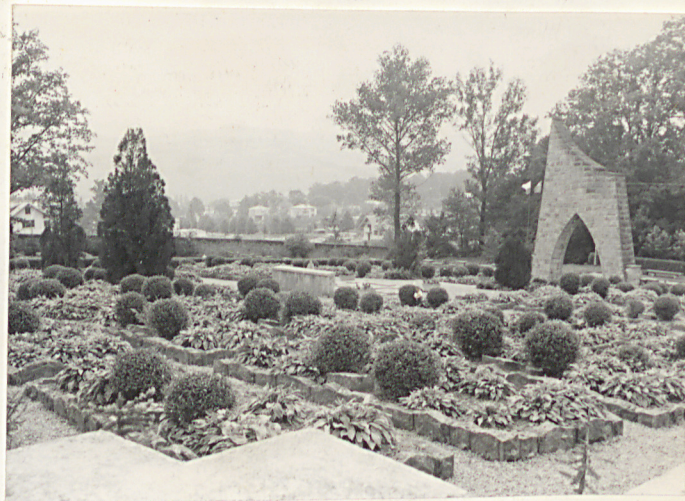
12. Widok ogólny