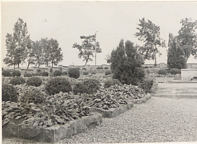
9. Kwatera lewa