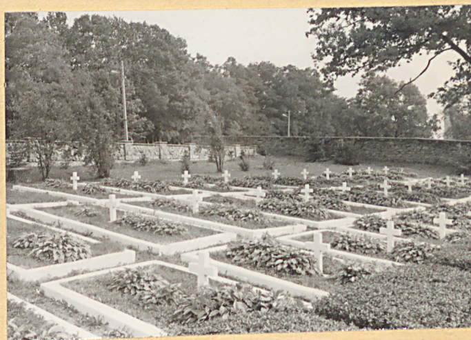
2. Kwatera żołnierzy WP z 1939r.