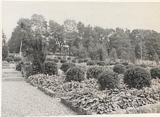
10. Kwatera prawa