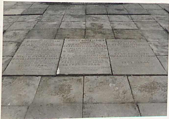
5. Tablice przed pomnikiem

"Chwała bohaterom Armii Radzieckiej i Czeskosłowackiej poległym w 1944 roku w okolicach Dukli w walce z hitlerowskim okupantem.