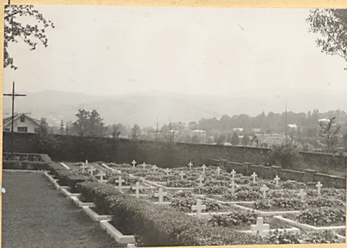
3. Kwatera żołnierzy WP z 1939r.