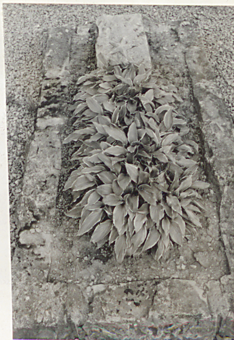
6. Mogiły żołnierzy Radzieckich

Cześć żołnierzom i partyzantom polskim poległym w walce z faszyzmem w latach 1939-1944. Społeczeństwo województwa Rzeszowskiego".