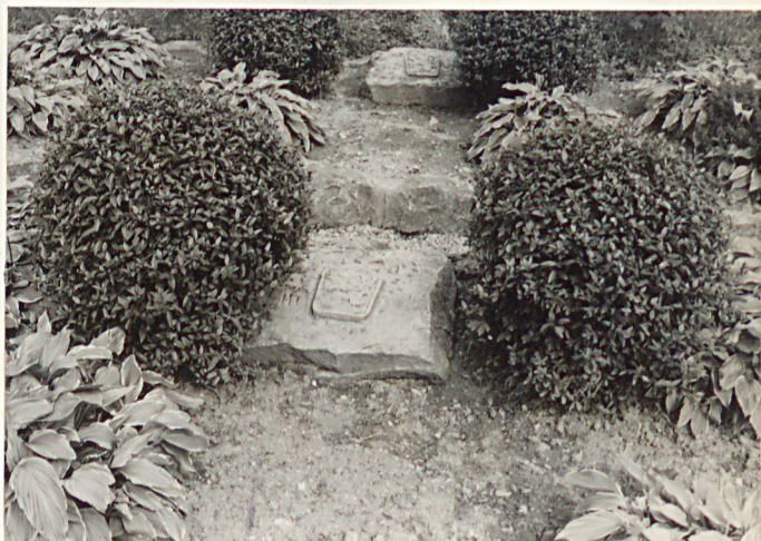
8. Mogiły żołnierzy czeskosłowackich.