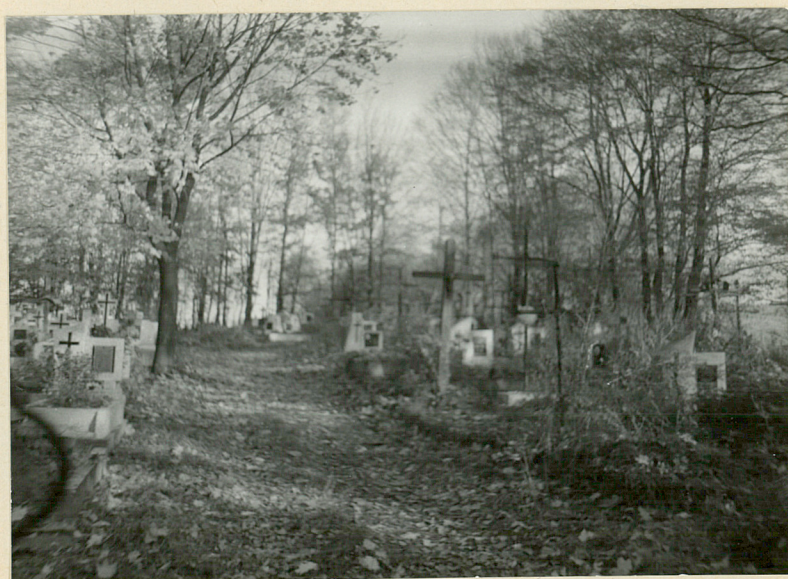
9. ALEJA BOCZNA W STRONIE PN.