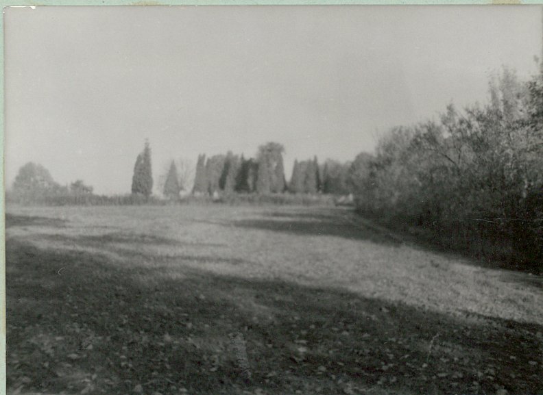
3. WIDOK OD PŁEWDNIA