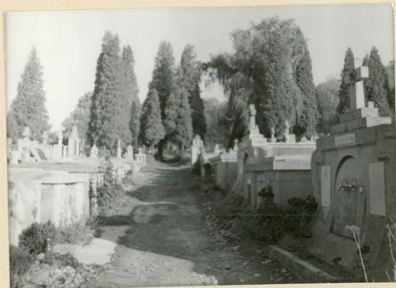
6. ALEJA GŁ. - STRONA PD.