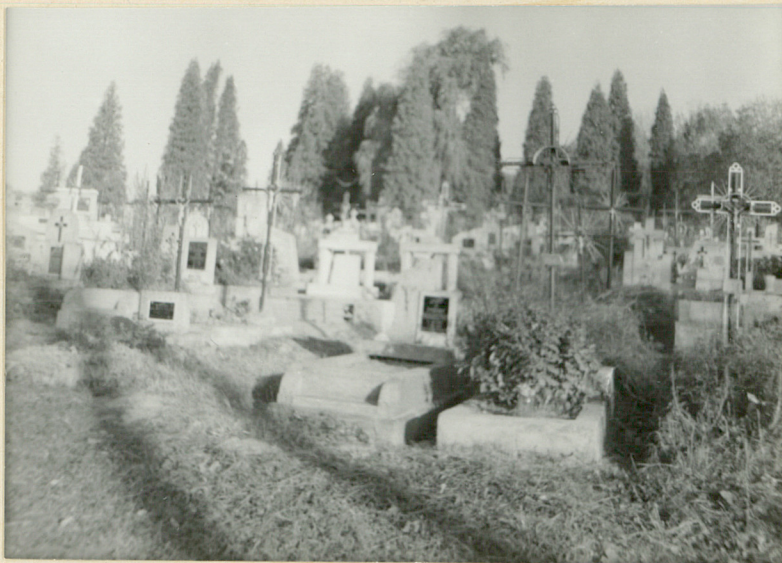
7. STRONA PD. - WSCH.