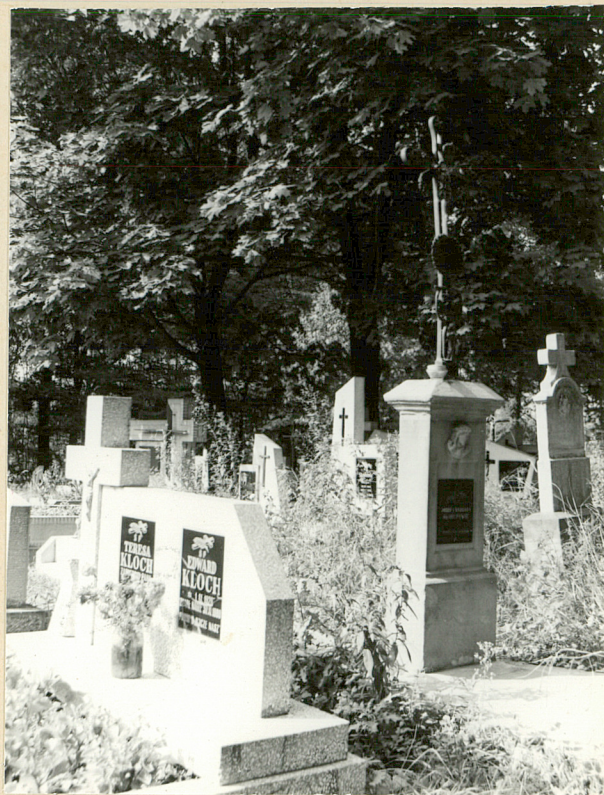
19. FRAGMENT STRONY ZACH. CZĘŚCI PN.