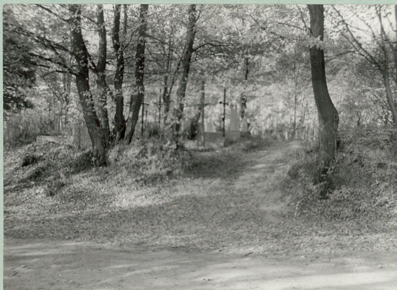
2. WEJŚCIE NA CMENTARZ W CZĘŚCI PN.