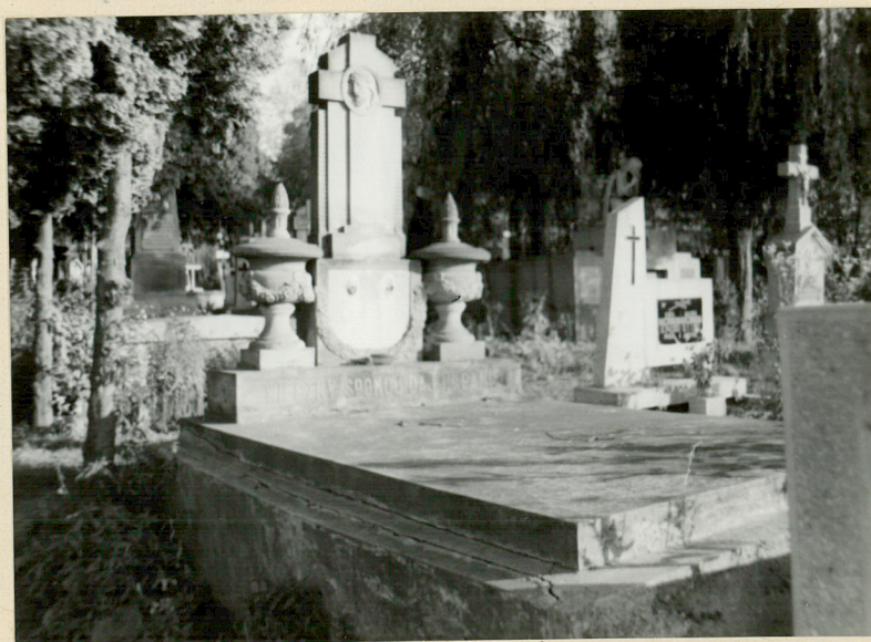
12. NAGROBKI W CZĘŚCI ŚRODKOWEJ STRONY PD.