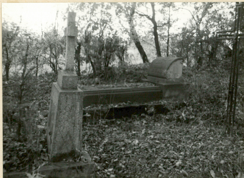
11. NAGROBKI Z POCZ. XX W.