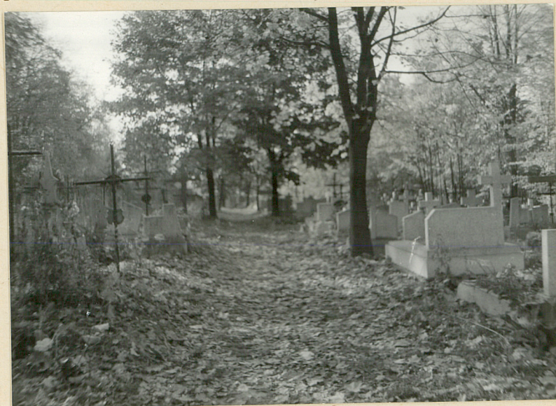
4. ALEJA GŁ. - STRONA PN.