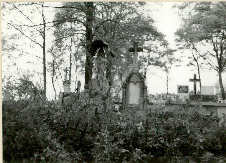
10. NAGROBEK Z 1886 R.