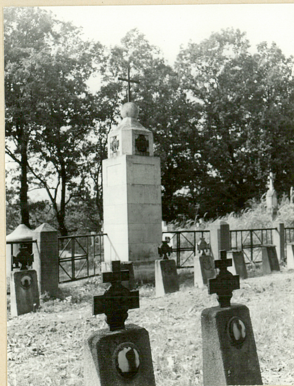
21.-22. CMENTARZ WOJENNY