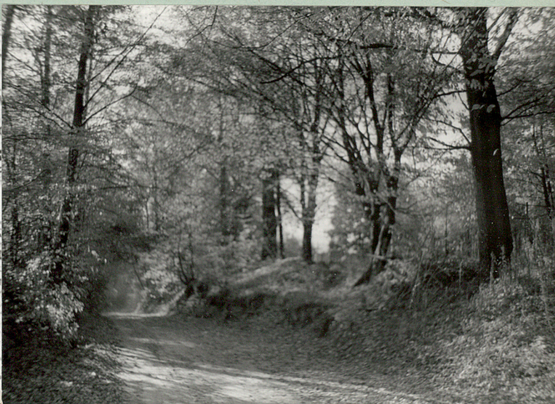
1. WIDOK Z DROGI NA CMENTARZ PO PRAWIEJ