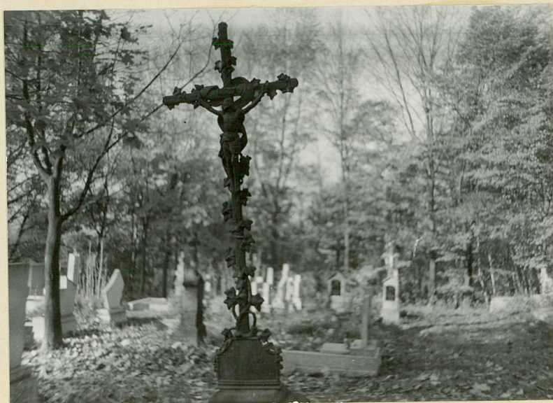
20. KRZYŻ ŁEWIŃNY z POC. XX w.