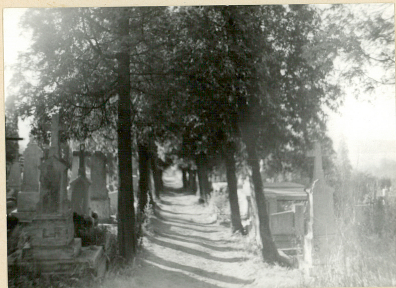
5. ALEJA GŁ. - CZĘŚĆ ŚRODKOWA