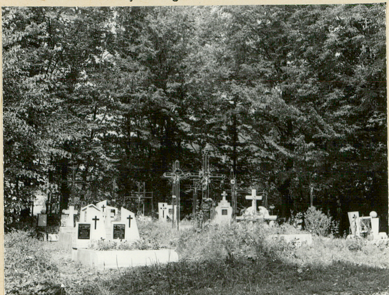
16. STRONA ZACH. CZĘŚCI ŚRODKOWEJ