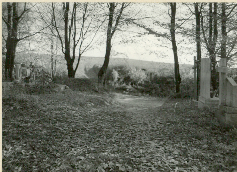
8. FRAGMENT STRONY PÓŁNOCNEJ