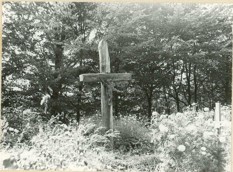
17-18. KRZYŻE DREWNIANE Z POŁ. XX W. W STR. ZACH.