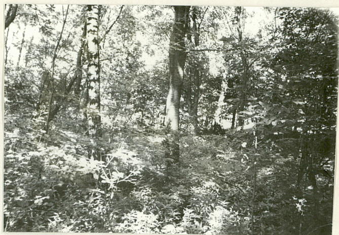
2. Widok ogólny