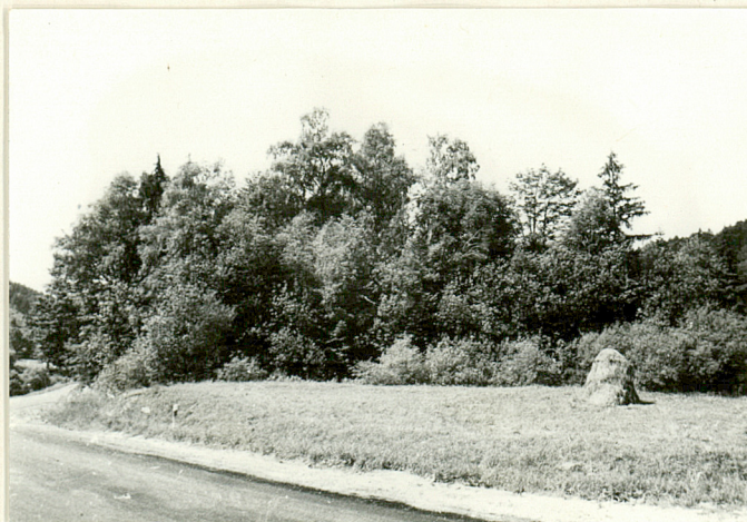
3. Widok z drogi