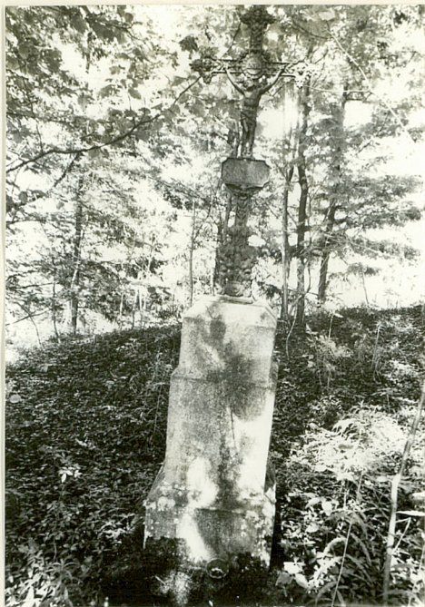
1. Nagrobek z krzyżem żel. z pocz. XX w. (napisów brak)