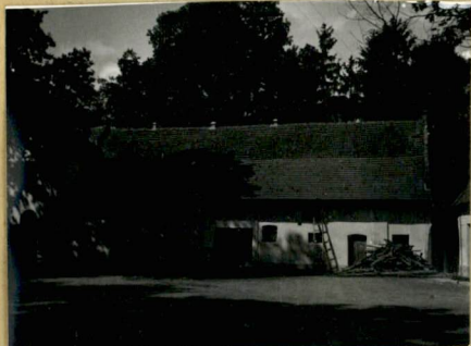
Zjeżdżalnie - sam. 1888, 18. 11. 57 - 12000 - kart.