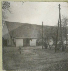
35. Uwagi różne

Bibliografia: Die Bau und Kunstschm möbel des Kreises Hainleu Hroctew, 1939.