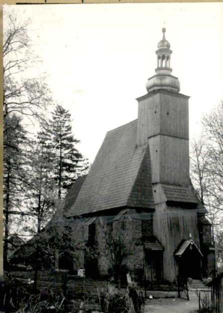
matyczny, uwagi opisowe, fotografia