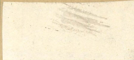
PLAN DOTYCZY SURZYDEK ZACH. 37.0