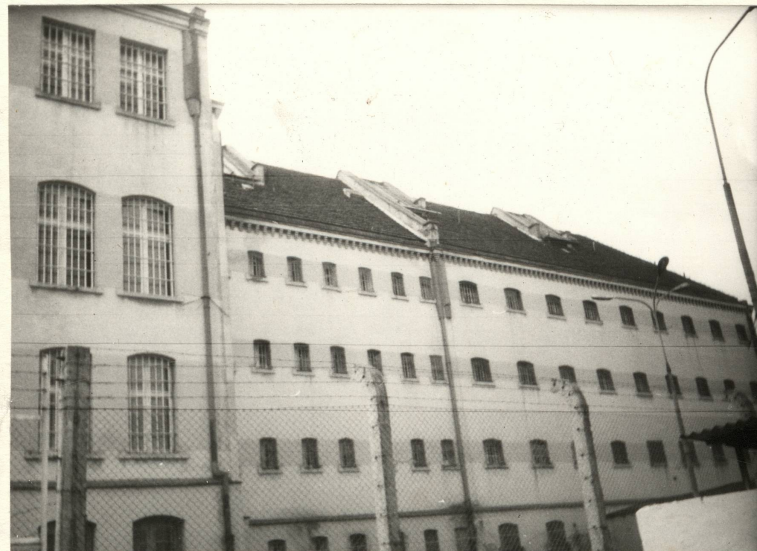
Elewacja półn. i zachodnia. Świetliki dachowe i okno doświetleniowe/szczytowe/.