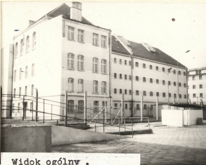
Widok ogólny . Elewacja wsch. i półn.

11. Zdjęcia, rzut, przekrój, sytuacja, orientacja