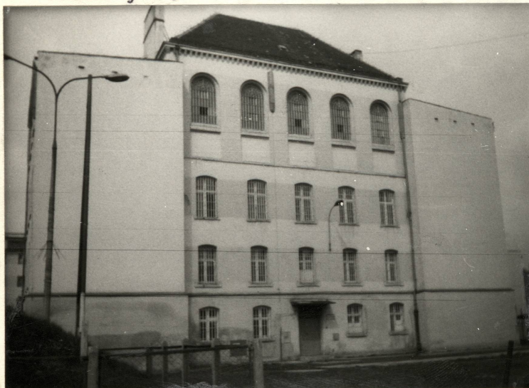
Elewacja wschodnia. Ryzality i elewacja frontowa

Elektryczna, centralnego ogrzewania. Wodno-kanalizacyjna, p.pożarowa. Alarmowa. Rynny i rury spustowe z połaci dachowych.