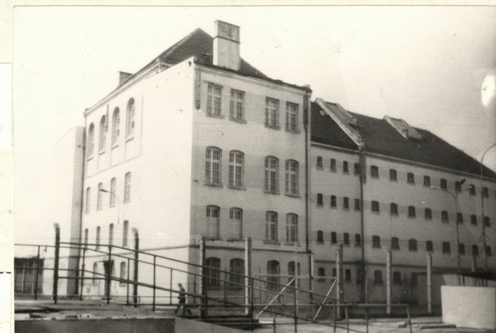
Elewacja północna. Ryzalit i korpus główny