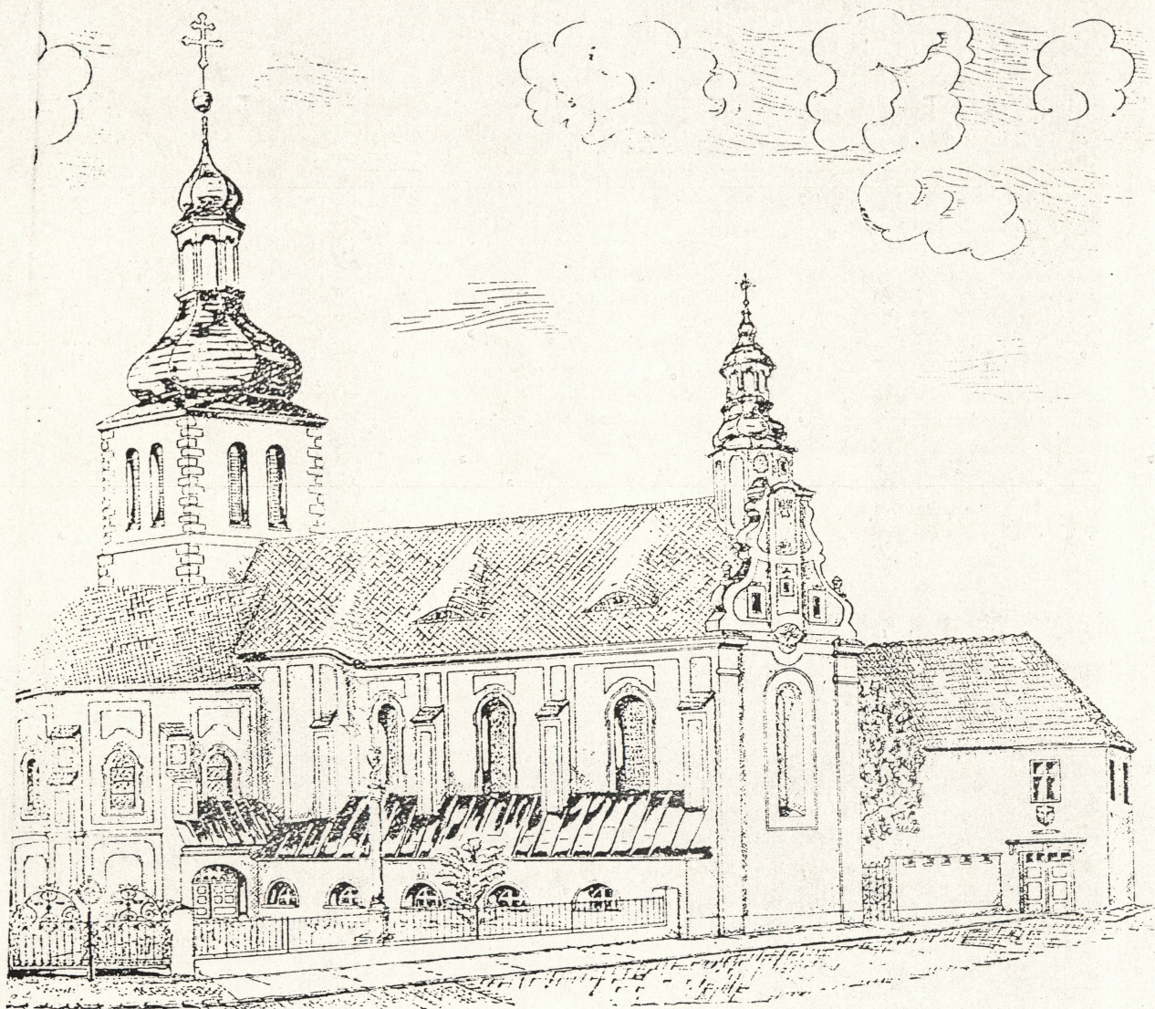
OGÓLNY WIDOK KOŚCIOŁA