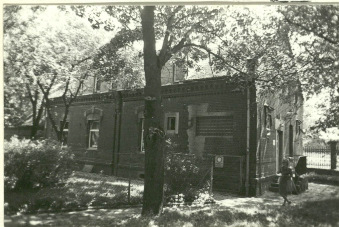
autor zdjęć P. Wasniowski data wykonania czerwiec 1981 miejsce przechowywania negatywów autor