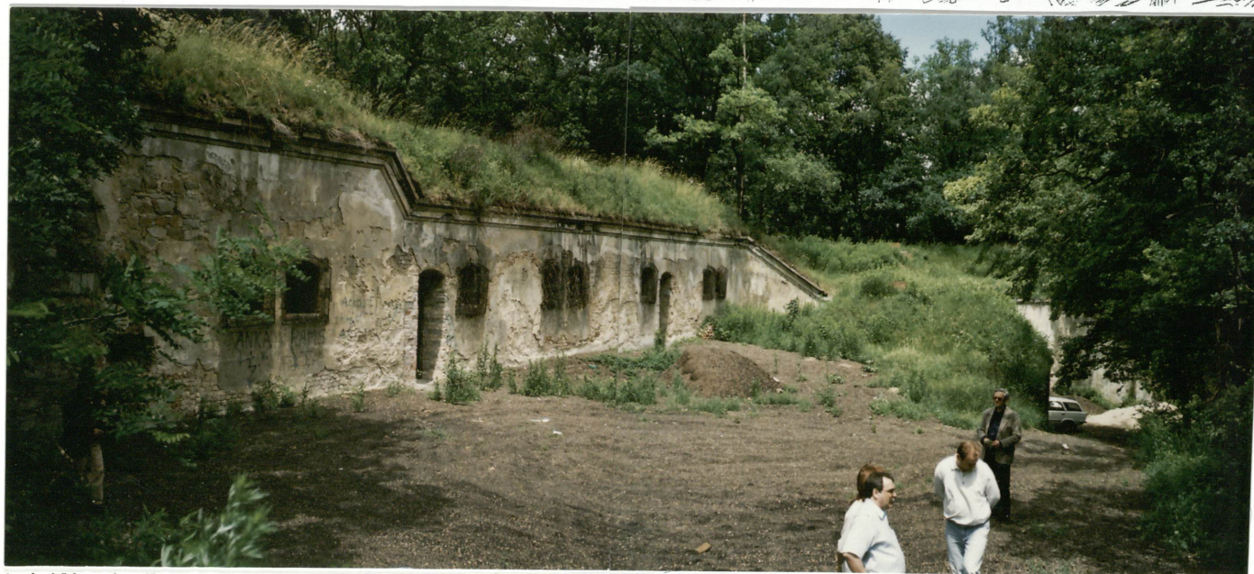
Fot. 1. Wysoka Bateria – schron kazamatowy; widok ogólny od płd-wsch