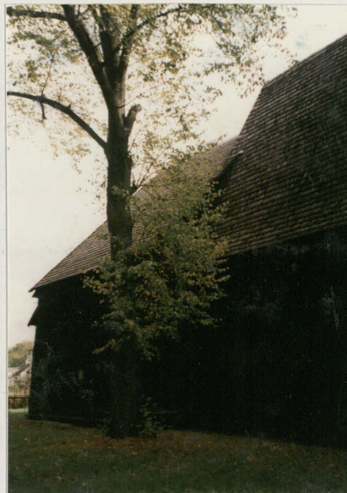
Elewacja wsch. - fragment