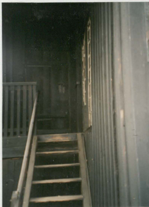
Schody zewnętrzne do łóży nad kruchtą