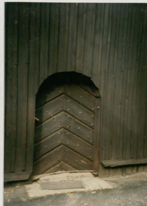
Drzwi do wieży