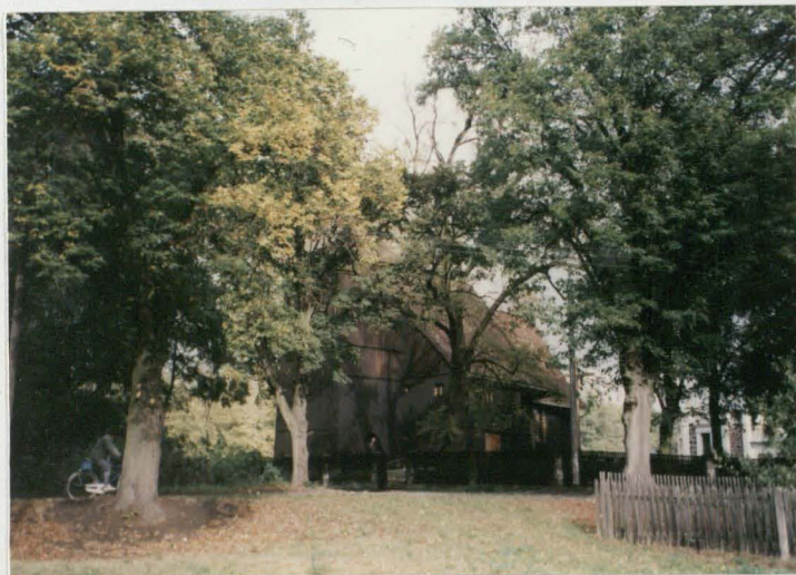
Widok ogólny z pd.-zach.