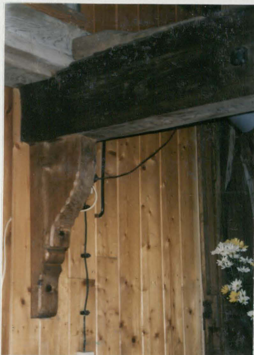
Wspornik belki tęczowej