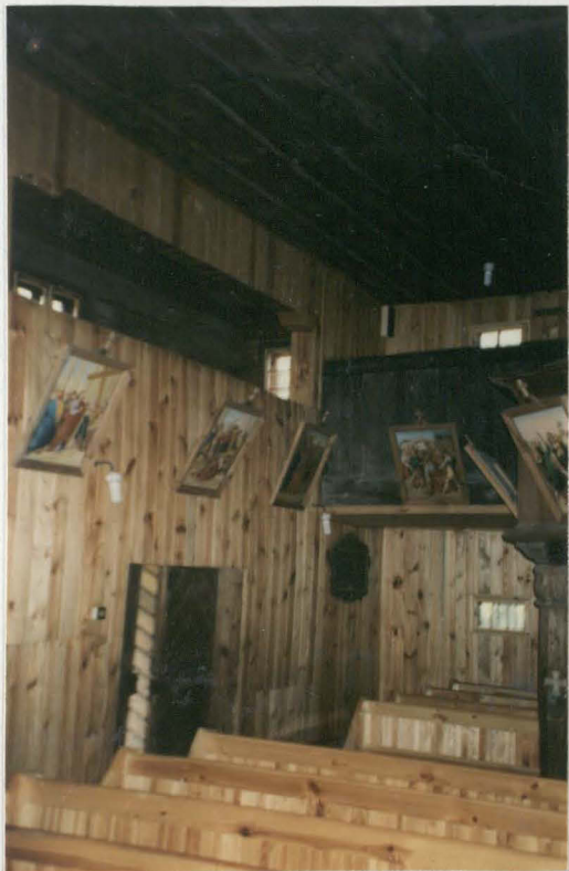
Wnętrze nawy - fragment