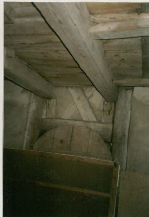
Wnętrze wieży - fragment