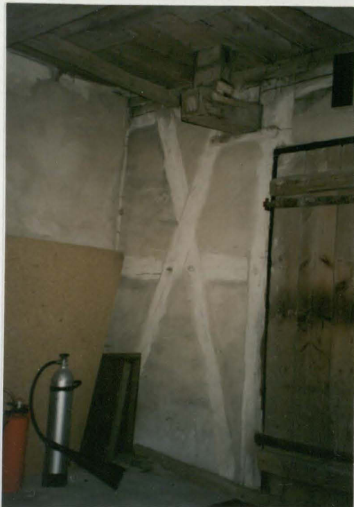
Wnętrze wieży - fragment