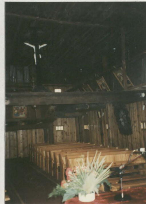
Wnętrze - nawa