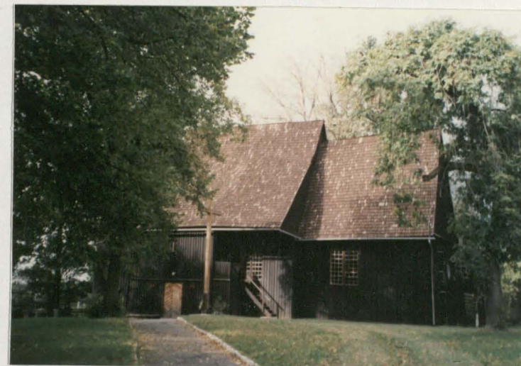
Widok ogólny od pd.