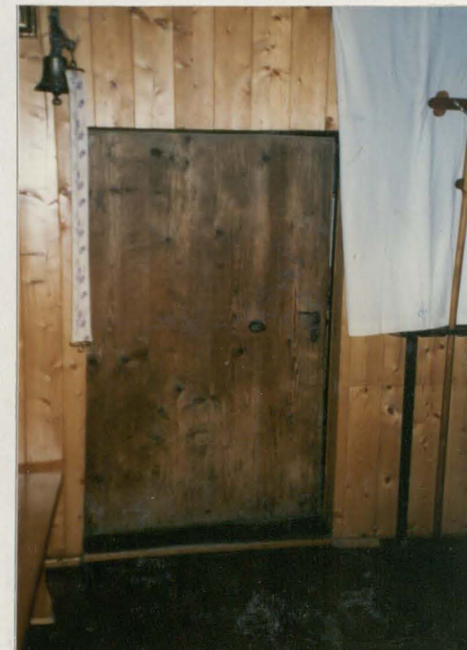
Drzwi do zakrystii