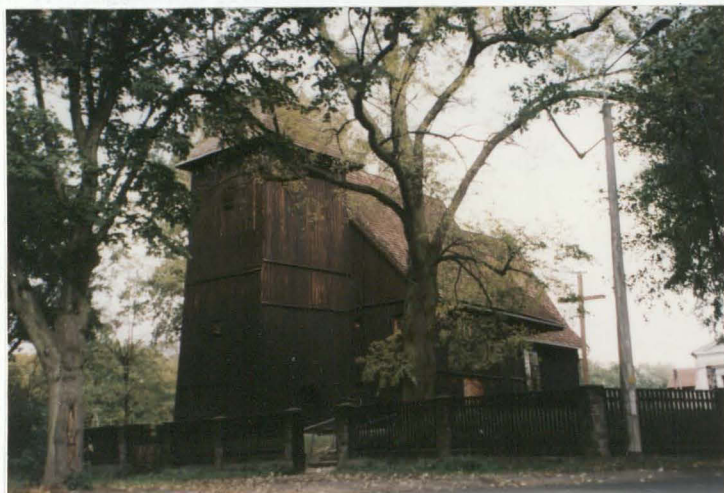
Widok ogólny od pd.

11. Zdjęcia, rzut, przekrój, sytuacja, orientacja