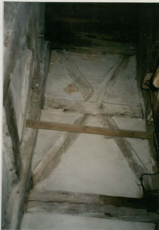
Wnętrze wieży - fragment