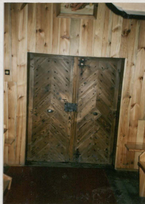
Drzwi z nawy do kruchty