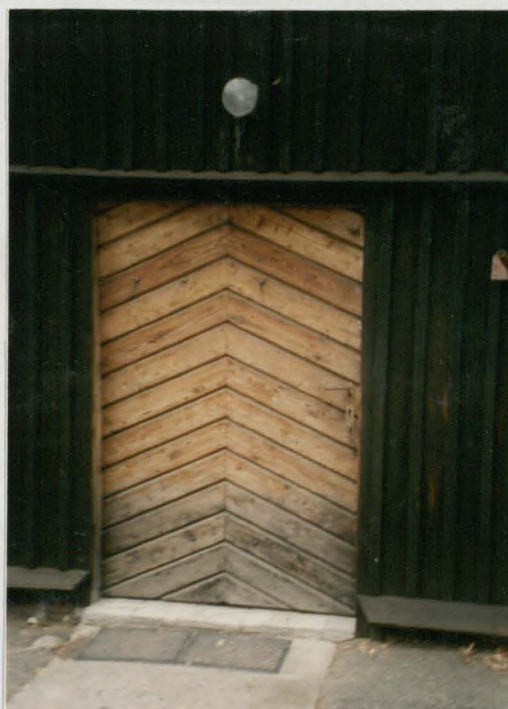
Drzwi do kruchty