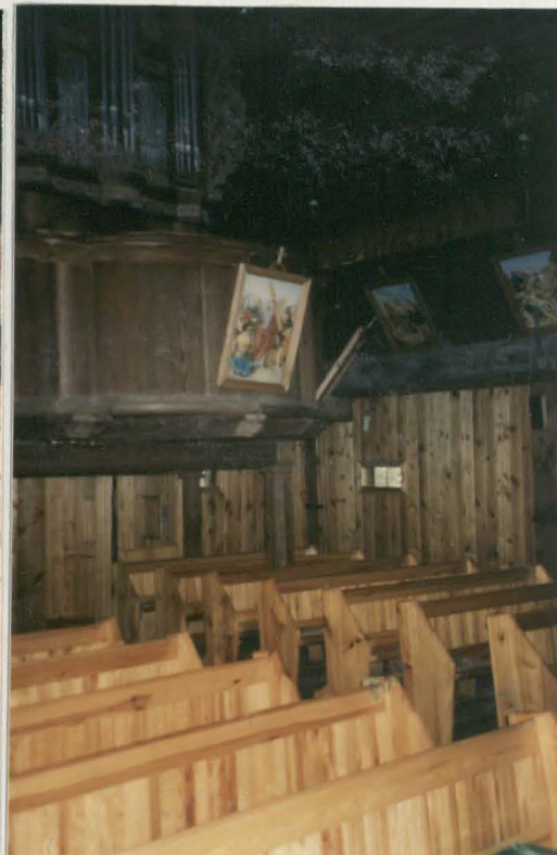
Fragment chóru i empory