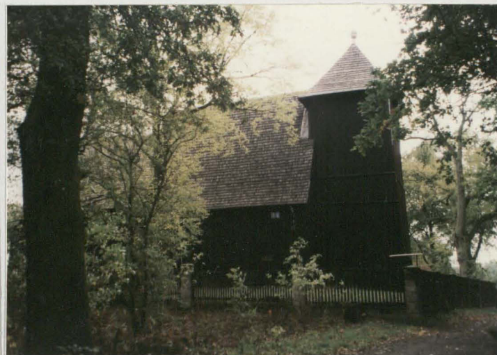
Widok ogólny od pn.