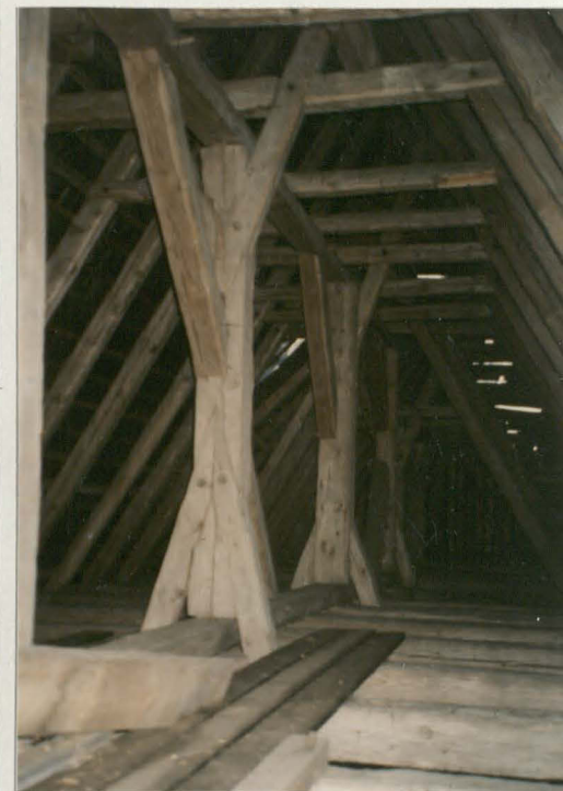
Wieżba - fragment