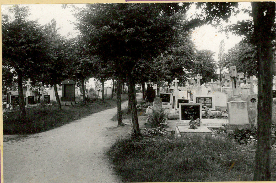
Aleja główna - fragmenty kwater wschodniej z częściowym widokiem kwater zachodniej.