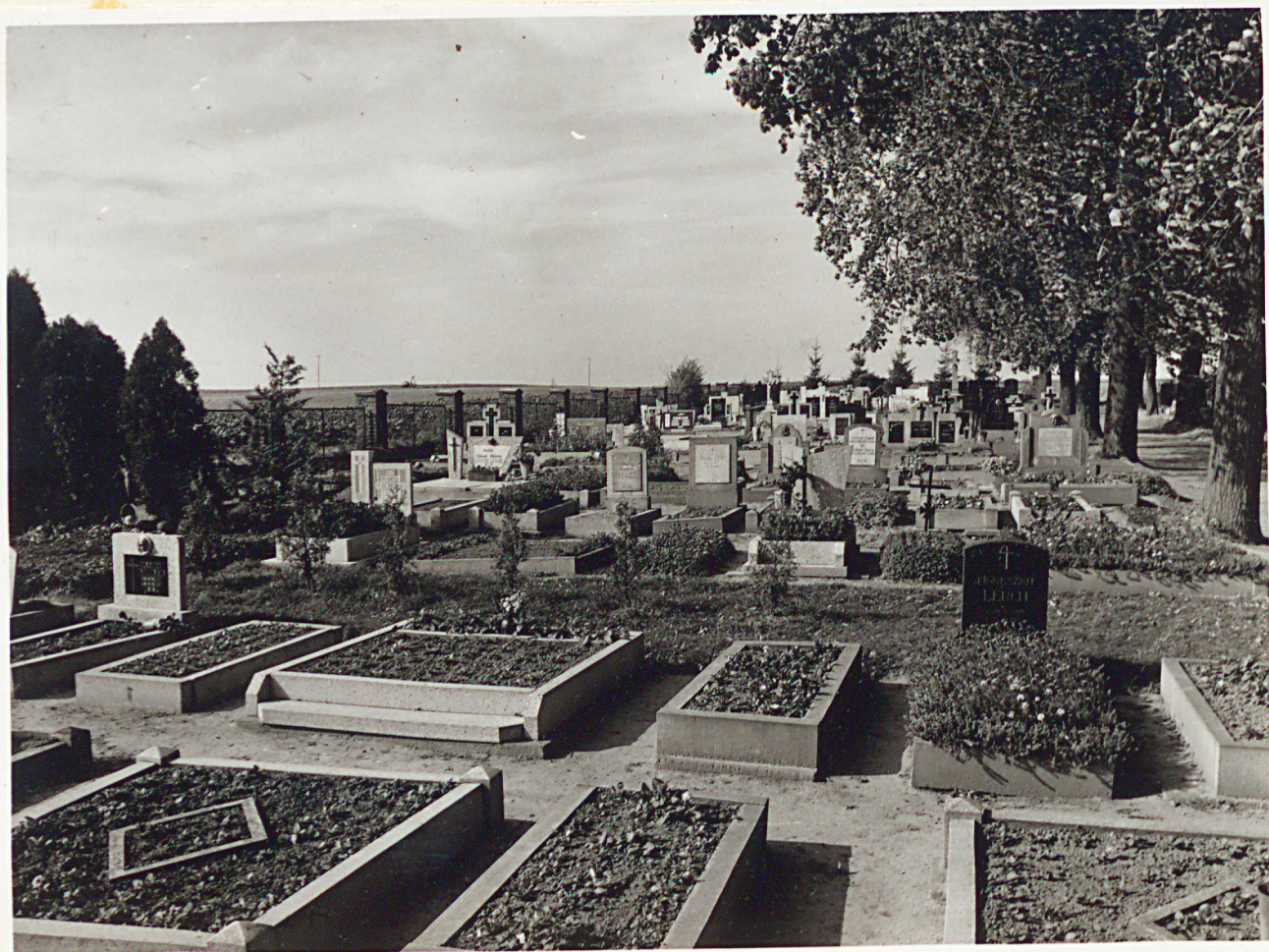
Widok cmentarza od strony południowej