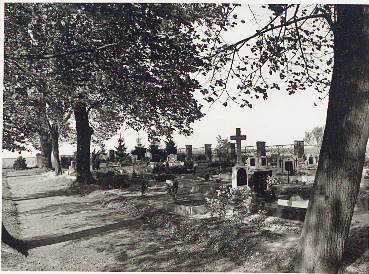
Widok cmentarza od strony zachodniej