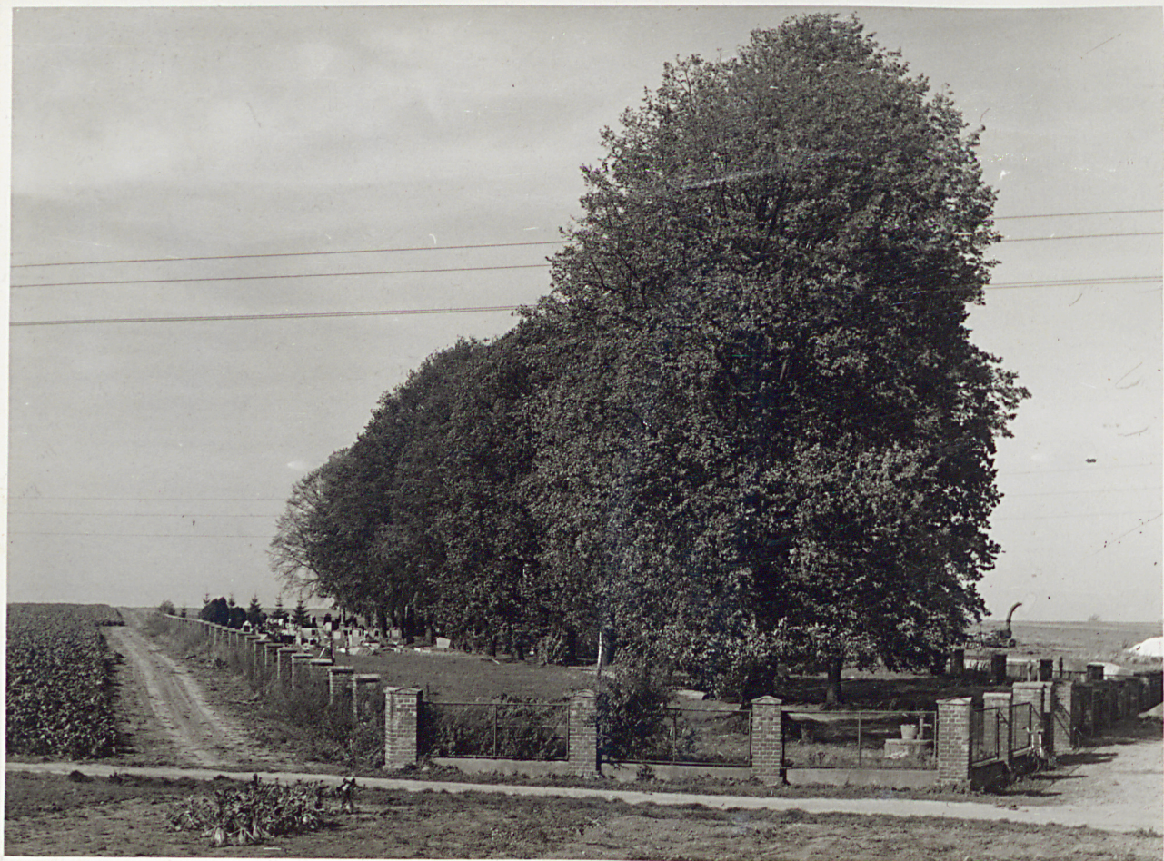
Wzłok cmentarza od strony wschodniej