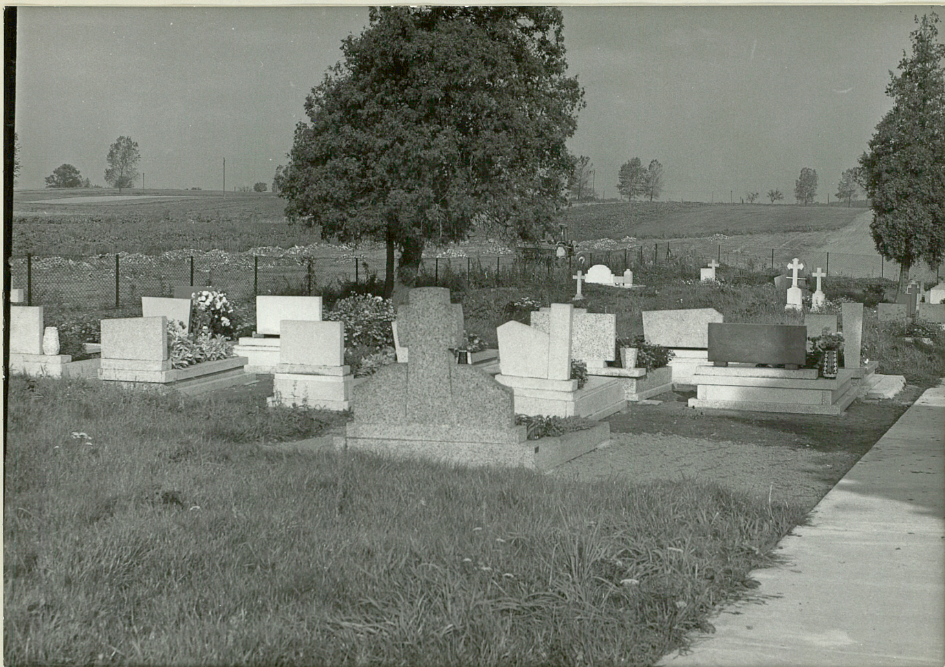
Centralna część cmentarza