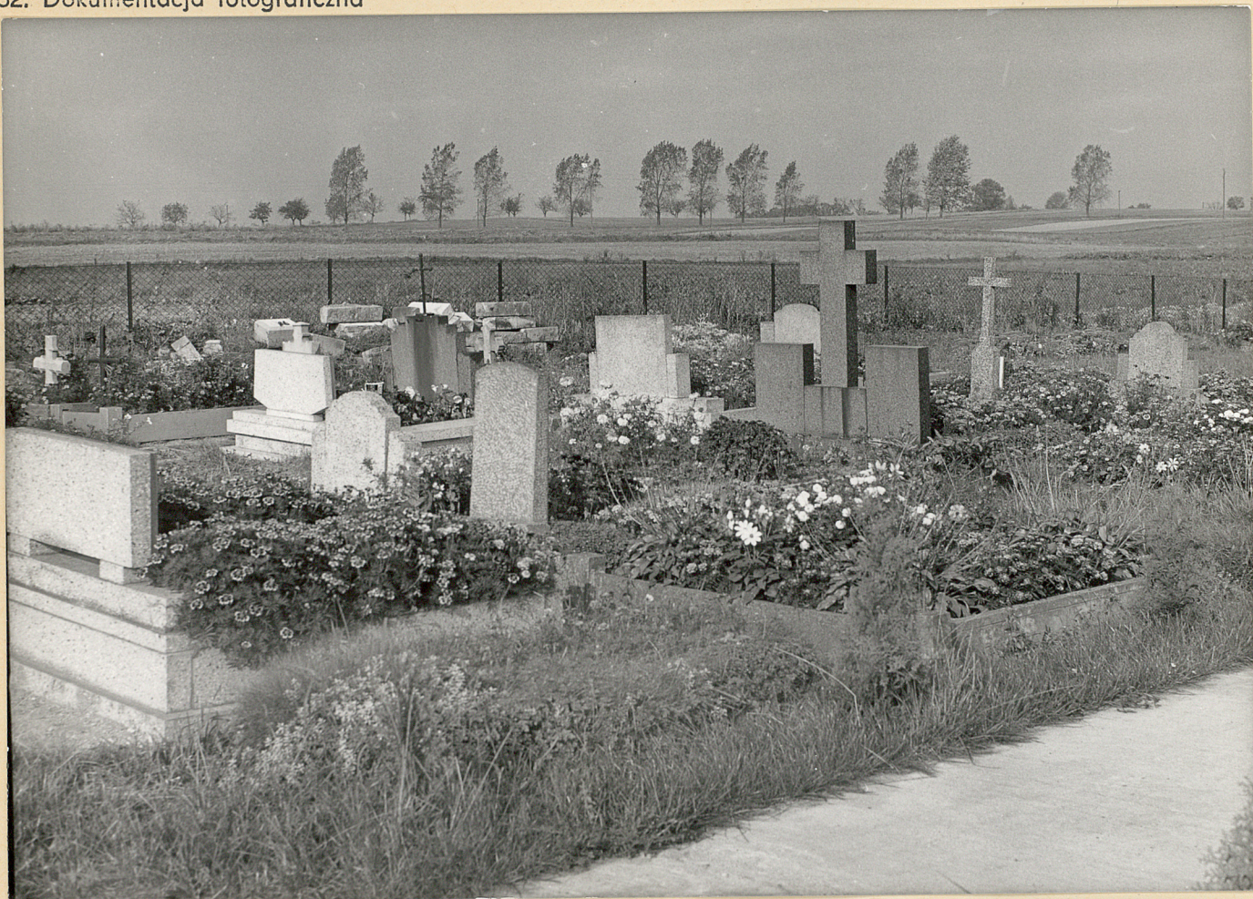
Lewa strona cmentarza od wejścia głównego