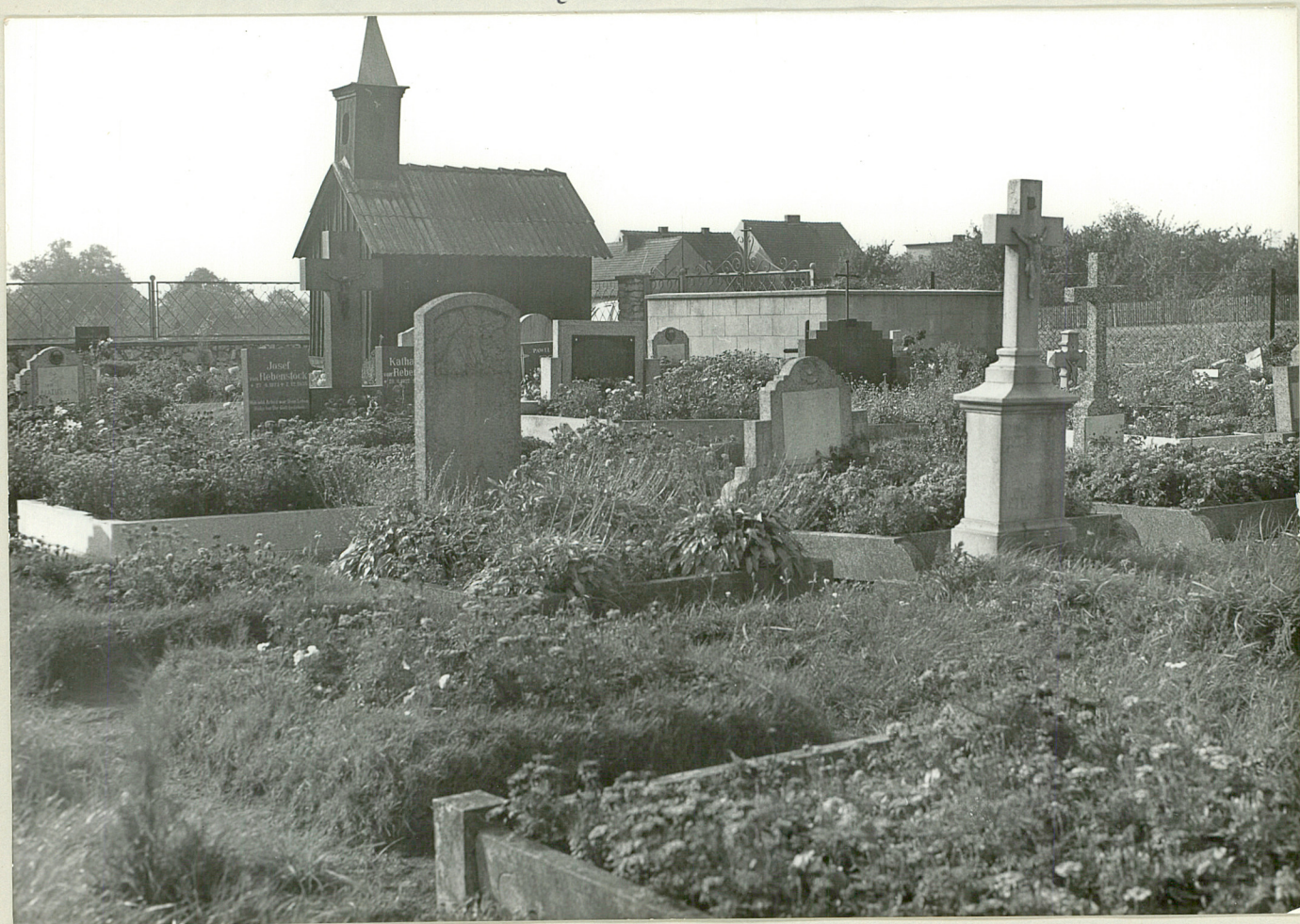
Widok cmentarza od strony wejścia