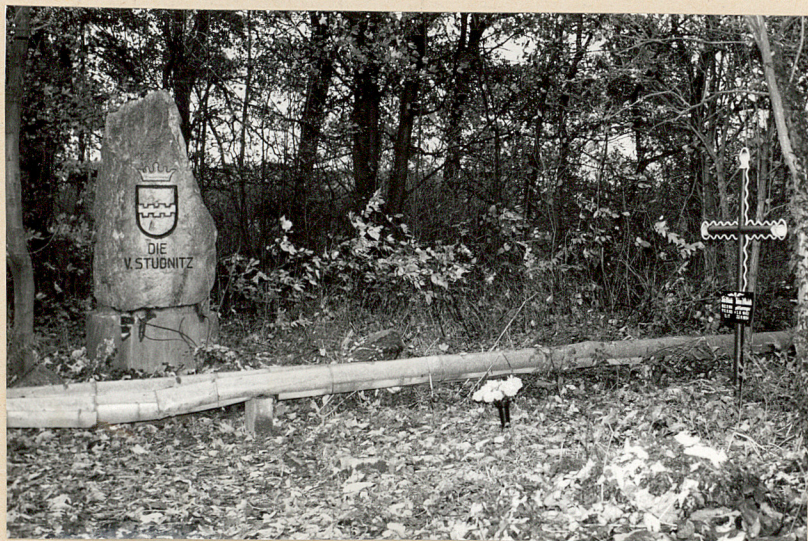
1. OGÓLNY WIDOK CMENTARZA