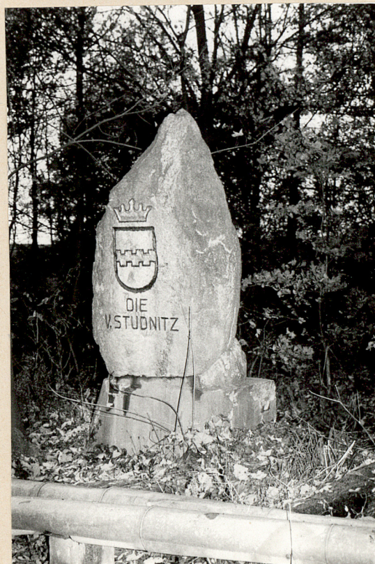
3. KAMIEŃ PAMIĄTKOWY