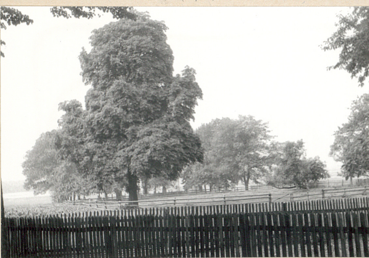
Widok na cmentarz od strony kościoła nym.-katol. /od wschodu/