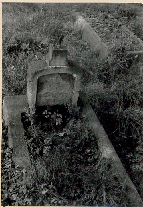
Najstarszy nagrobek z datą 1813 r.