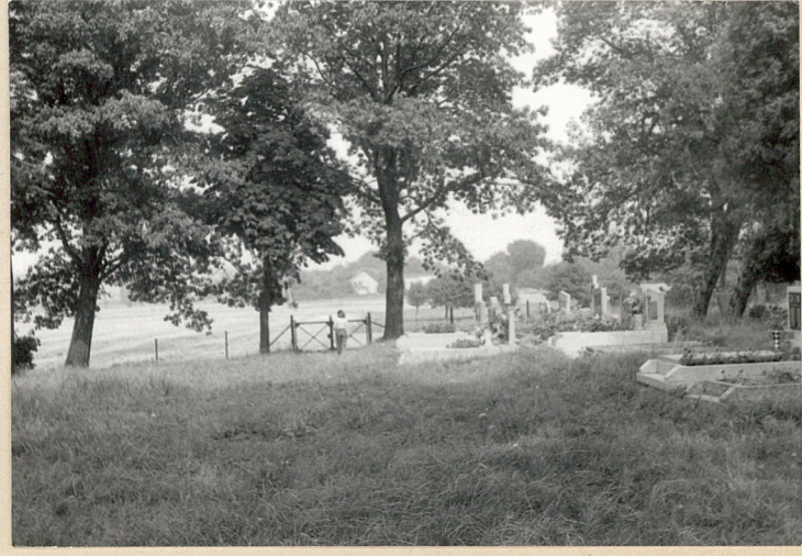
Widok z wnętrza cmentarza w kierunku bramy /w kier. północnym/