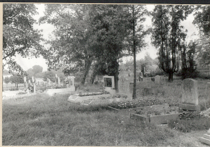
Widok na wschodnią część cmentarza, pokrytą grobami / od południa /