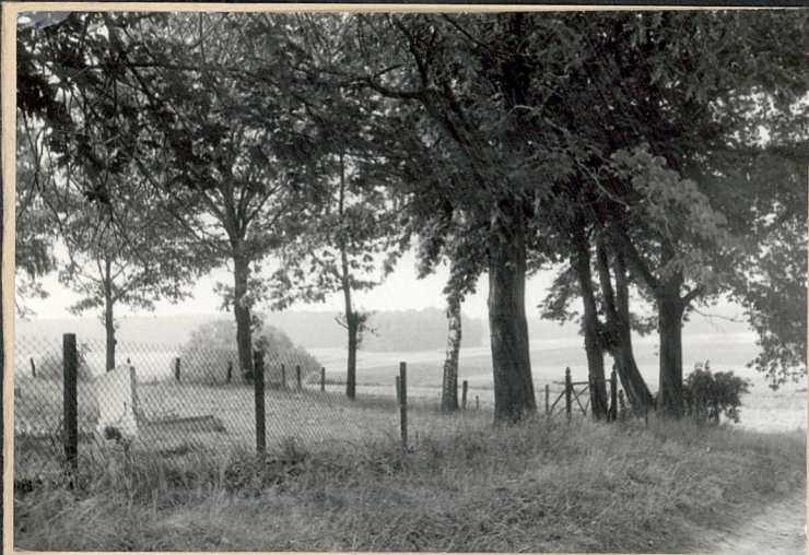
Widok na północną, czystą część cmentarza