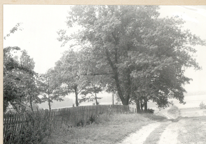
Widok na cmentarz od ptn.-wschodu, z polnej drogi