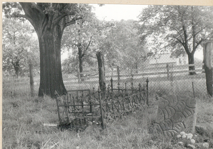
Bezimienny grób w żeliwnym ogrodzeniu