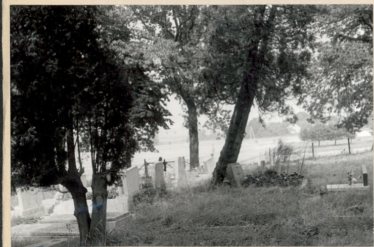
Wnętrze wschodniej części cmentarza, pomiędzy grobami tuje