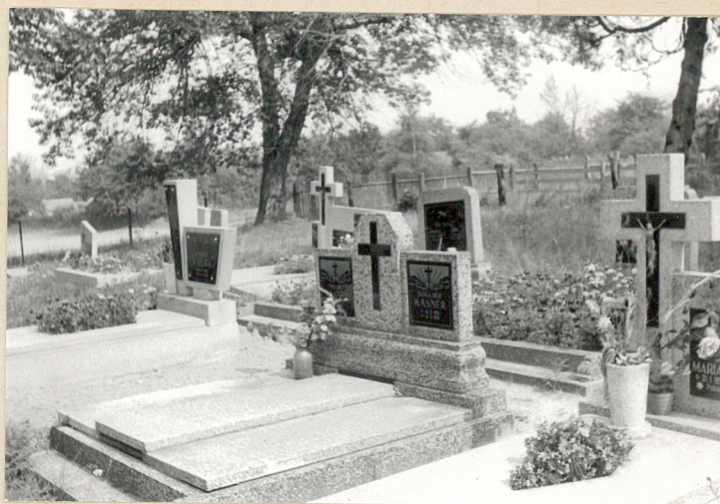
Nowe groby z końca l. 70-tych.