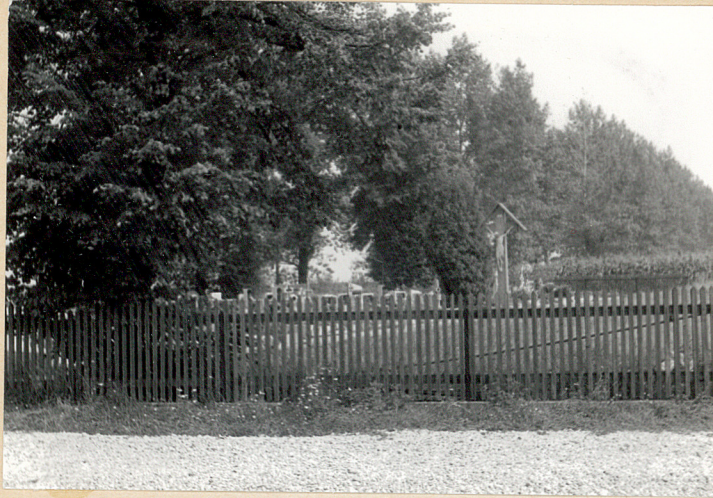
Widok cmentarza od południowego-zachodu