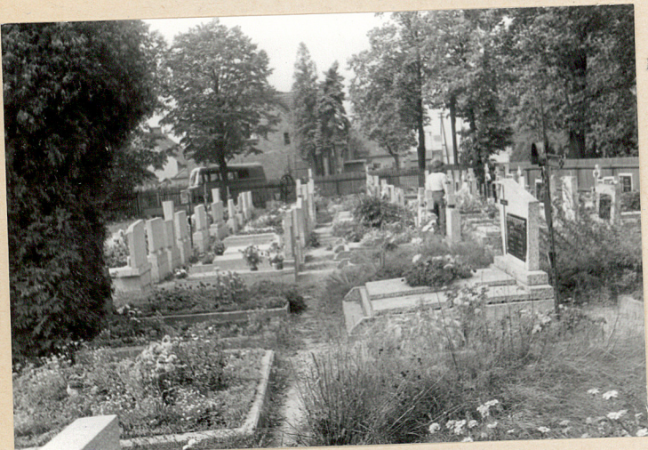
Pokryta grobami północhna część cmentarza - widok od wschodu