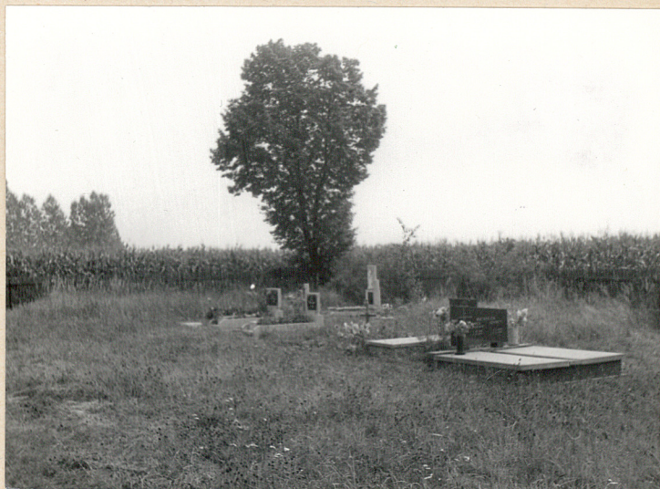
Jedynie groby w południowej części cmentarza