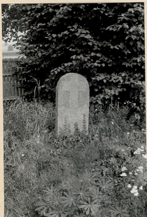
Najstarszy nagrobek z 1819r prawdopodobnie przeniesiony z cmentarza przykościelnego