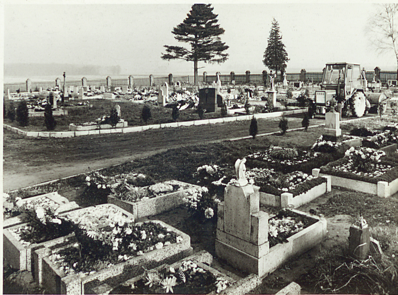
widok ogólny od bramy