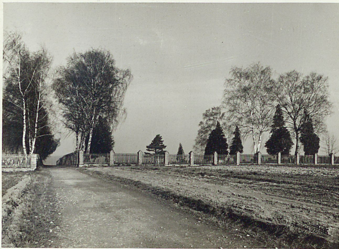
widok ogrodzenia cmentarza