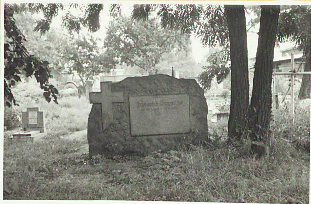
Widok na połudn. część cmentarza