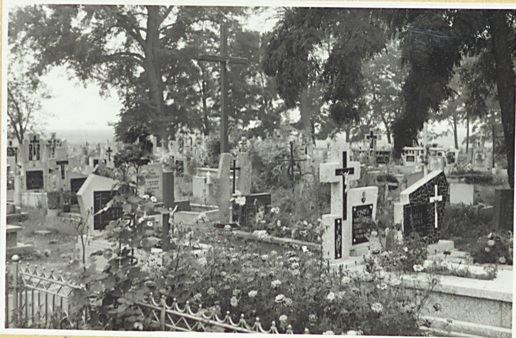
Widok na połudn.-zachodn. część cmentarza