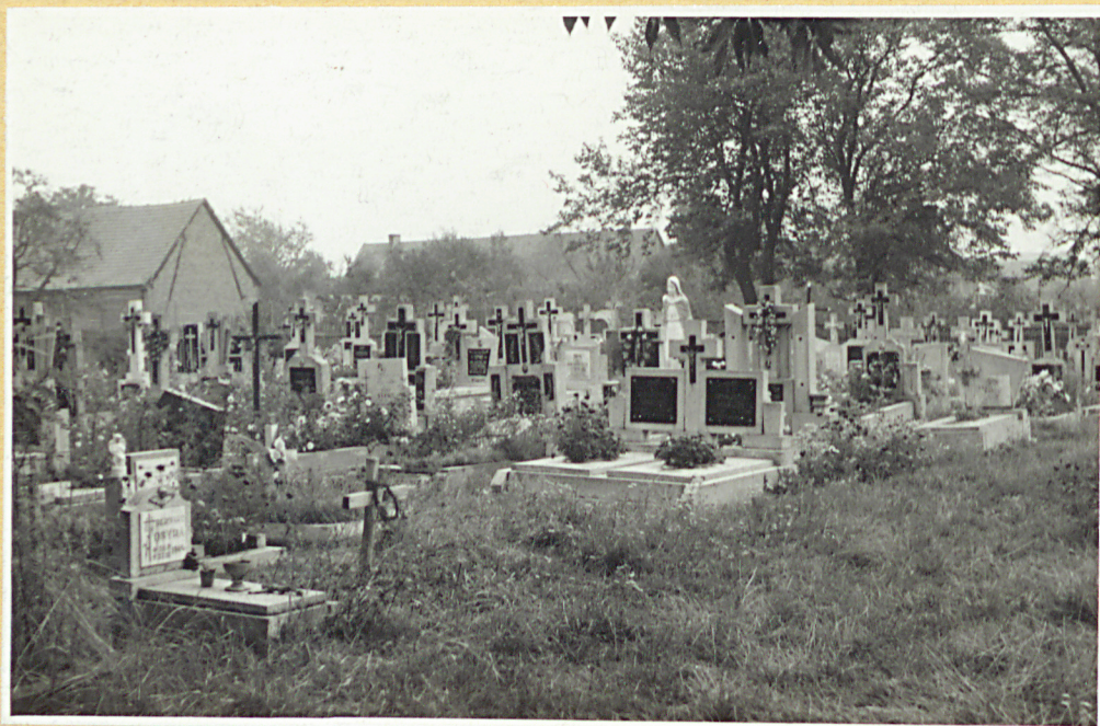
Widok na połudn.-wsch. część cmentarza