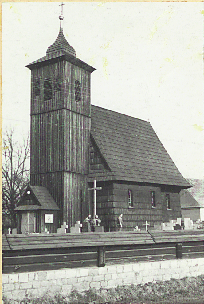
KOŚCIÓŁ Z 1599 r.