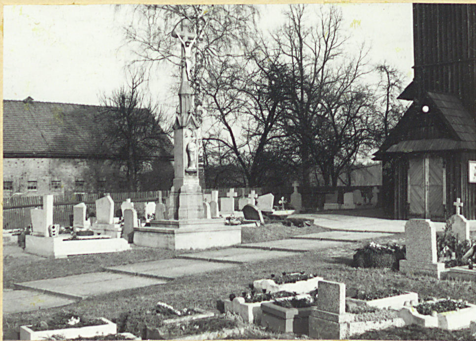
ZACHODNIA CZĘŚĆ CMENTARZA. Z KRZYŻEM.