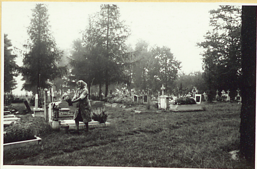
Widok na półn.-wsch. część cmentarza