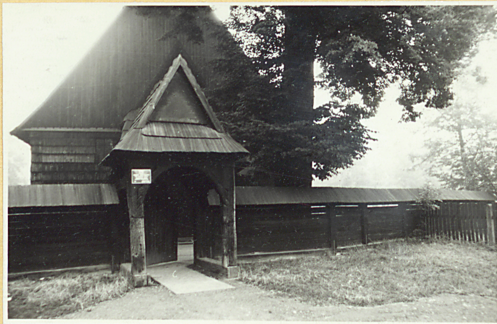
Widok na półn.-wsch. część cmentarza