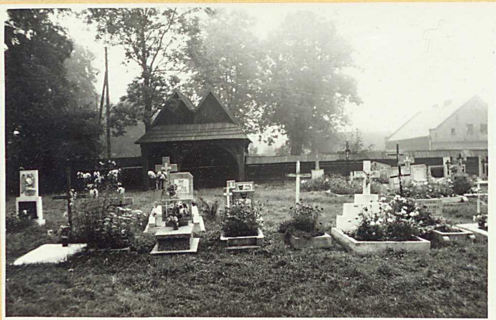
Widok na półn.-wschodn. część cmentarza