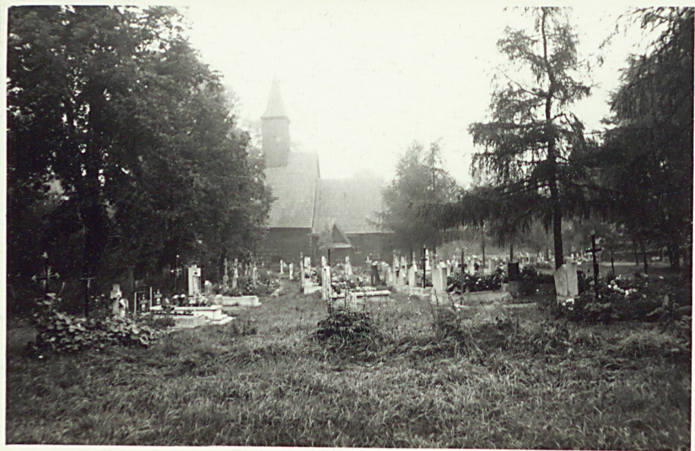
Widok na półn.-zachodnią część cmentarza