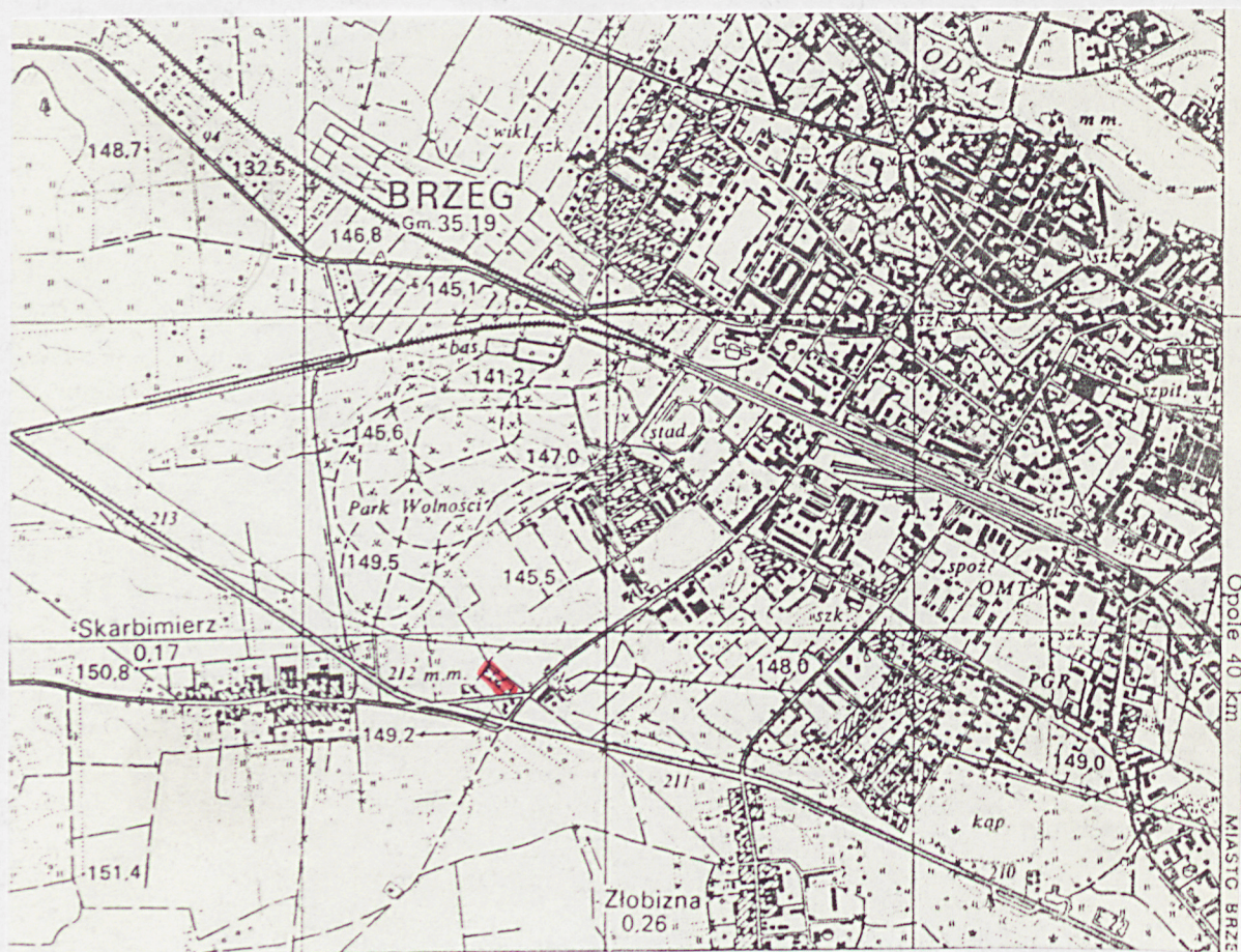
Fragment mapy topograficznej w skali 1:25 000.