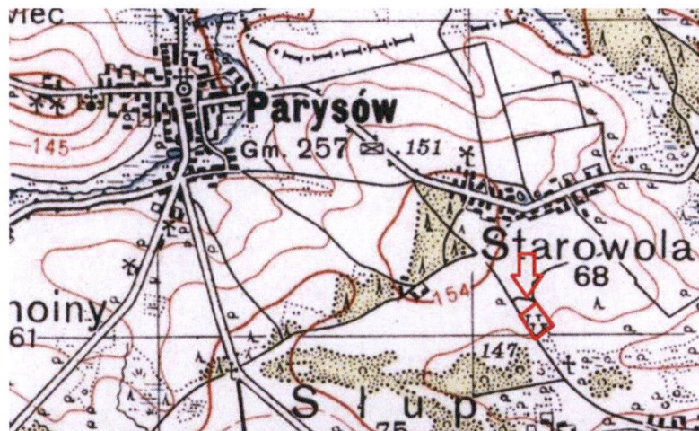
Mapa WIG P41_S33_GARWOLIN wyd. 1937 r. 1:100000