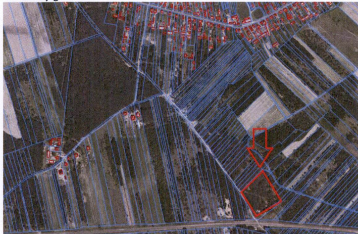
Geoportal – ortofotomapa z lokalizacją cmentarza