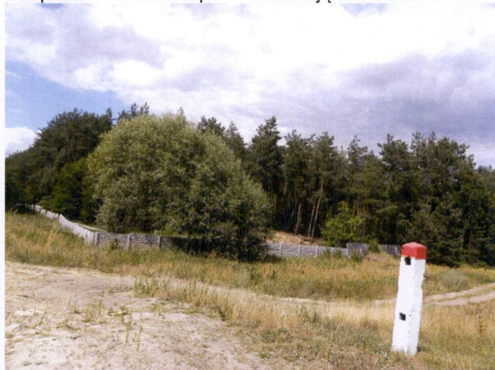
Widok na teren d. cmentarza od strony torów