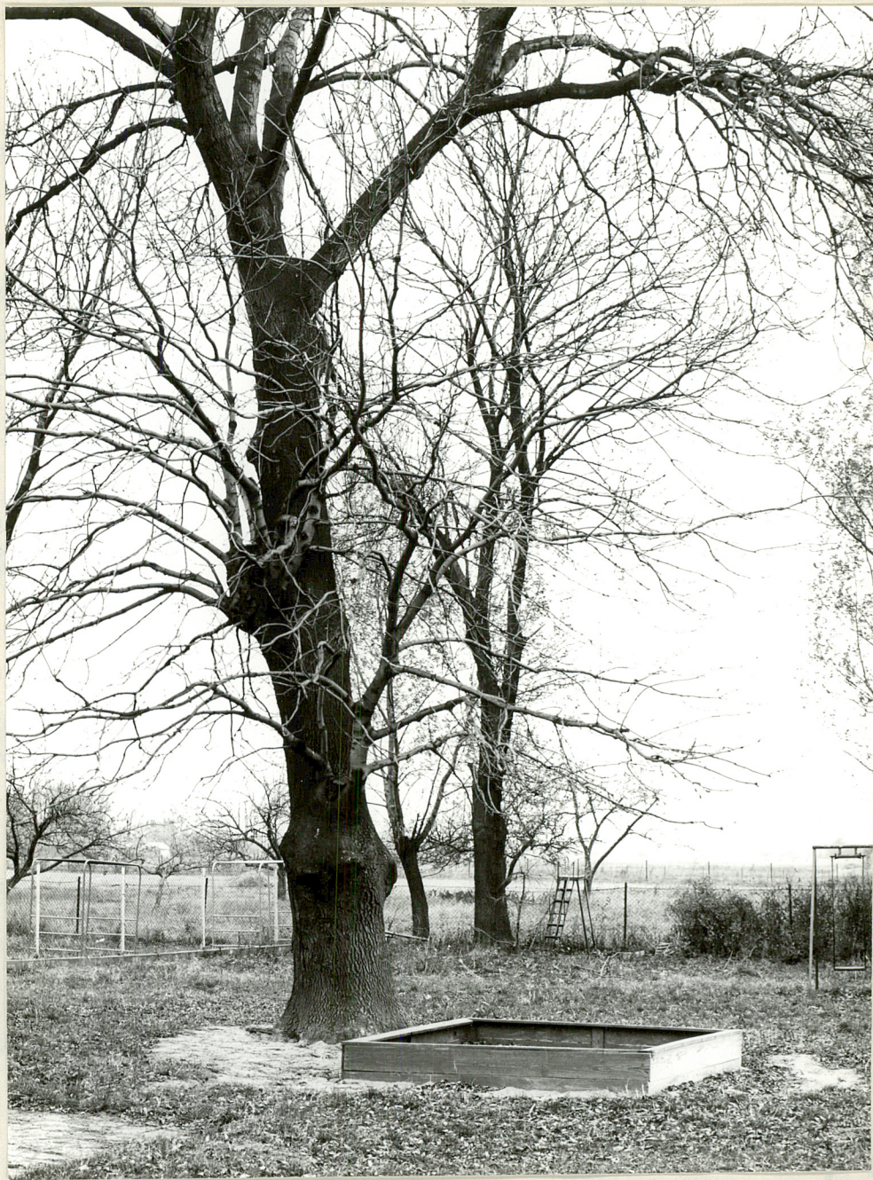
Fot. 3. Kąty. Stary jesion w pobliżu dworu 11.1981 r.