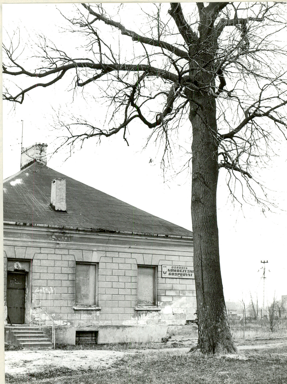
Fot. 2. Kąty. Elewacja zachodnia dworu i pomnikowy jesion 11.1981 r.