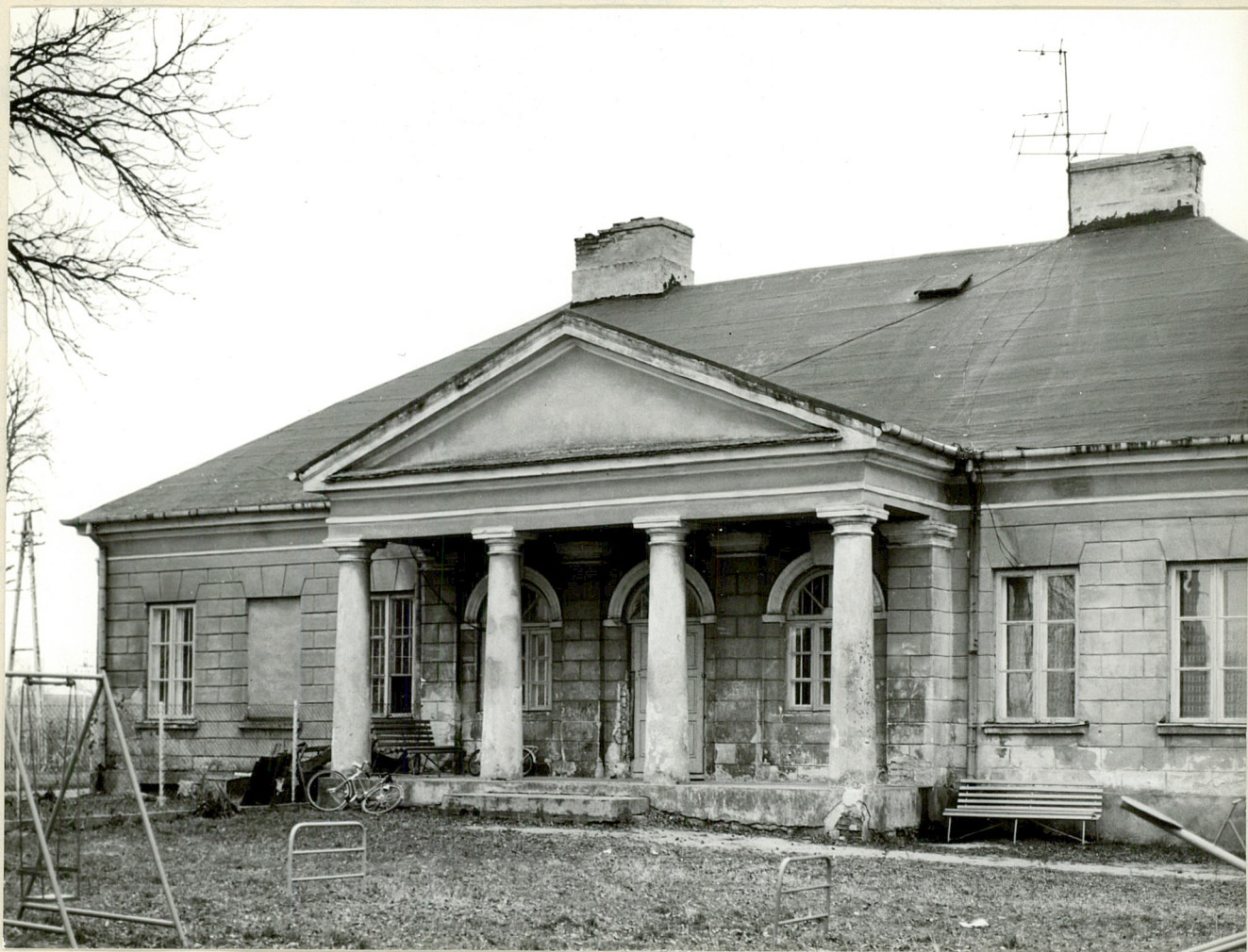
Fot. 1. Kąty. Elewacja ogrodowa dworu 11.1981 r.