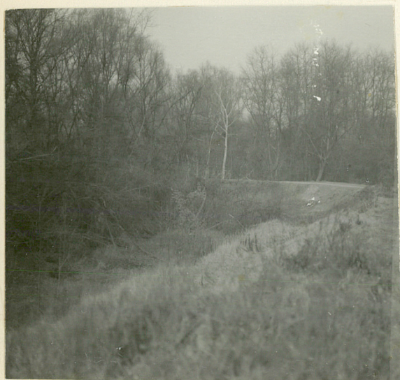
Widok na wał prawego banku i czoła. Kierunek pñ. - wsch.

Wkładkę założył: mgr L. Jaszewski 1986.12.20