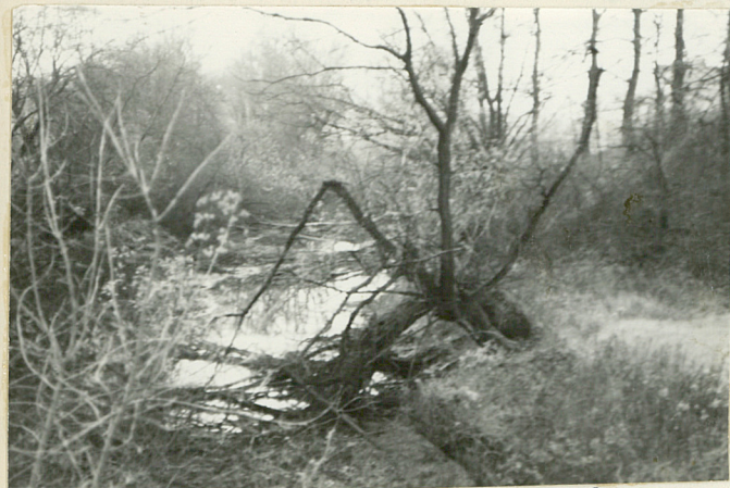
Widok na rów lewego banku. Kierunek pñ. wsch.