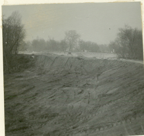
Widok na wał czoła. Kierunek wsch.