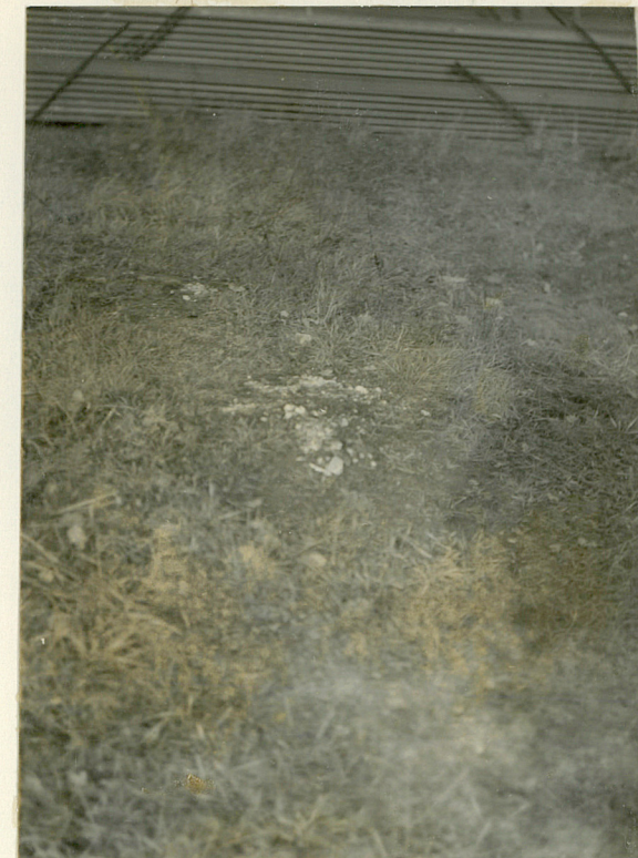
Niewygotowany dziedziniec. Resztki fundamentów budowli.

Jed. W.A. Olsztyn z. 135/S OZGraf. Z.P. Ostróda z. 676 n. 40 000