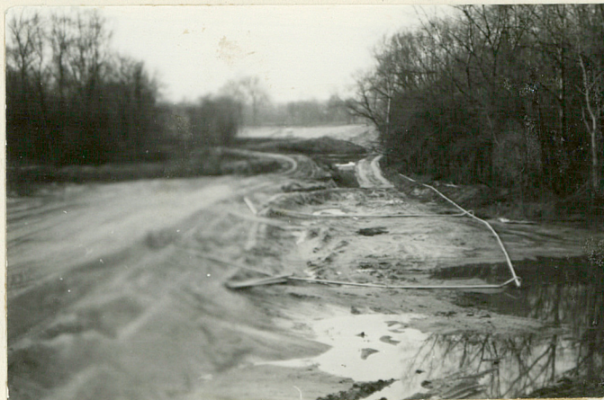
Widok na zniwelowany wał banku i czoła. Kierunek wsch. - pñ.