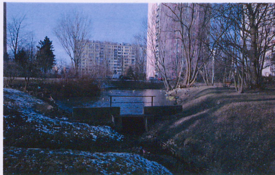
Kanał na jeziorze przy uroczysku