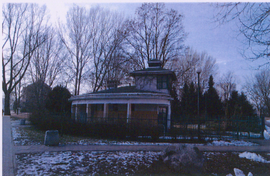
Budynek ujęcia wody oligoceńskiej