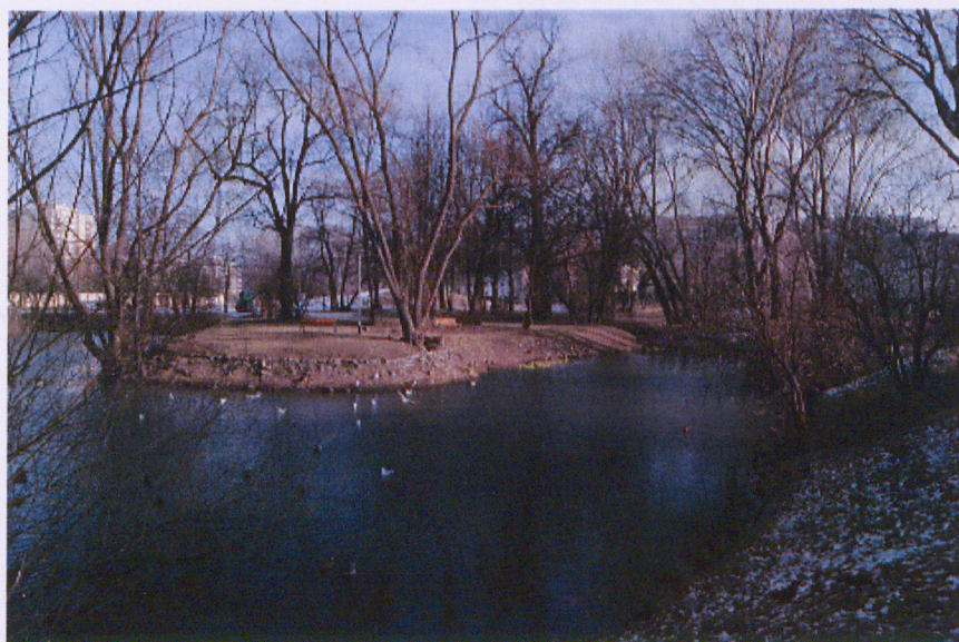
Uroczysko wraz z wyspą od strony (widok od strony zachodniej)