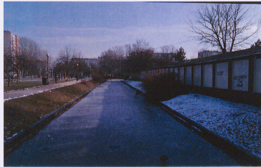
Kanał łączący stawy; po lewej stronie widoczny plac zabaw, po prawej mur dyrekcji osiedla