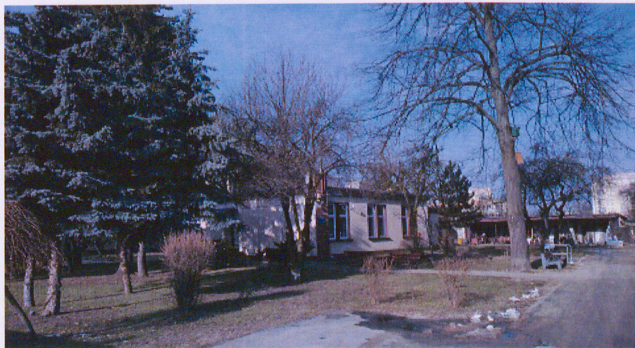
Widok na teren dyrekcji osiedla