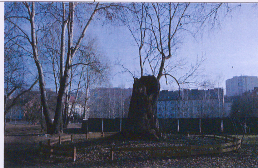
Pozostałości jesionu – Pomnika Przyrody