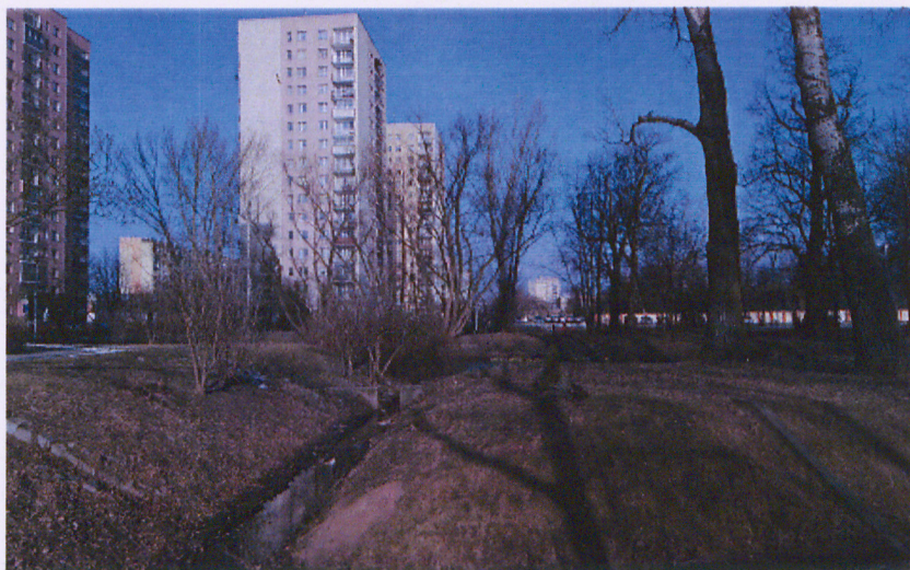
Uroczysko wraz z częścią kanału (widok od południa)