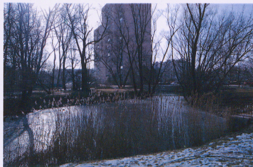
Uroczysko od strony zachodniej