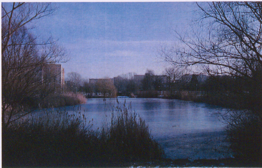
Staw 1 wraz z widocznym w głębi mostkiem na kanale oraz murem dyrekcji osiedla