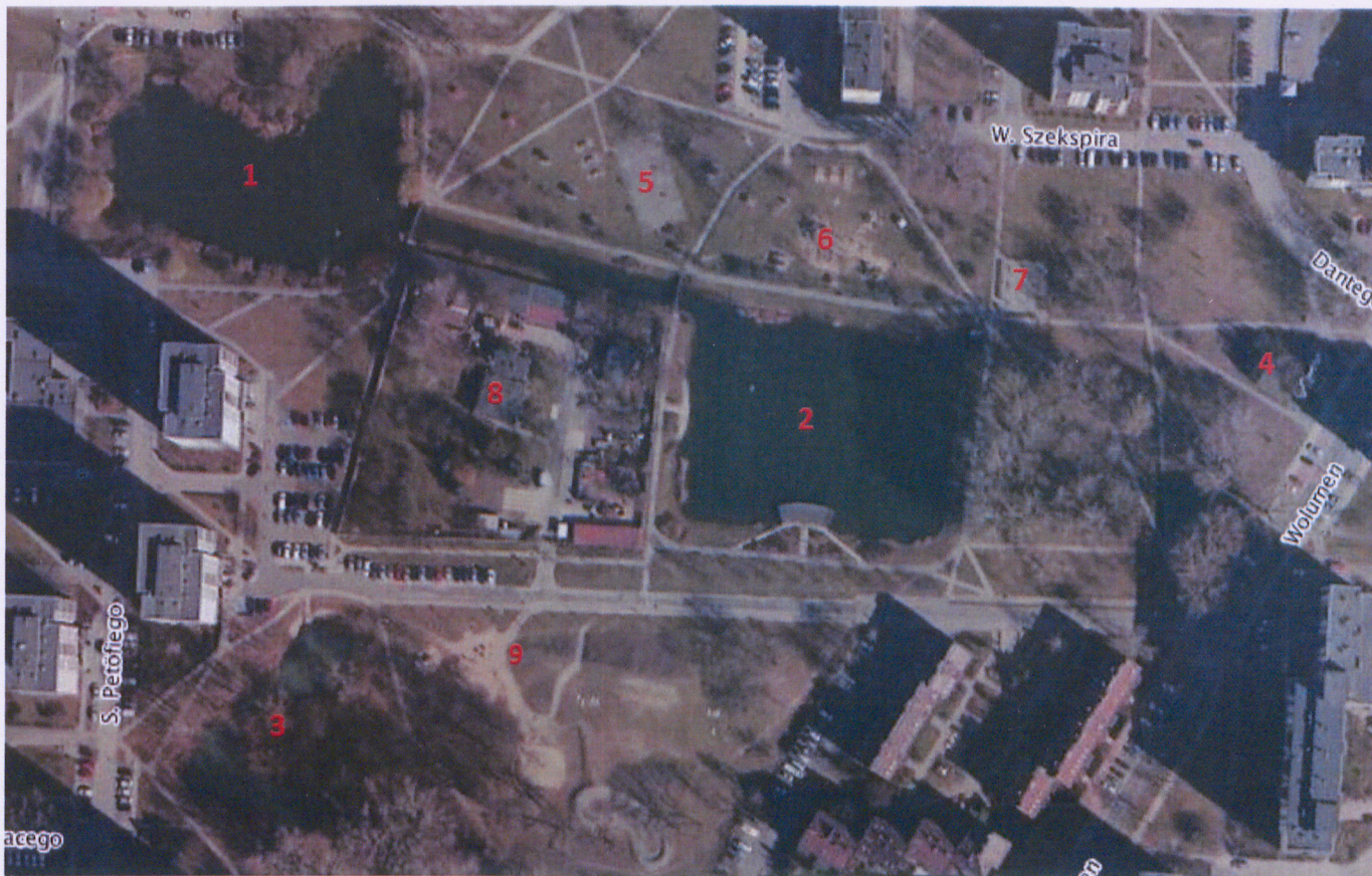
Obiekty na terenie Stawów Brustmana: