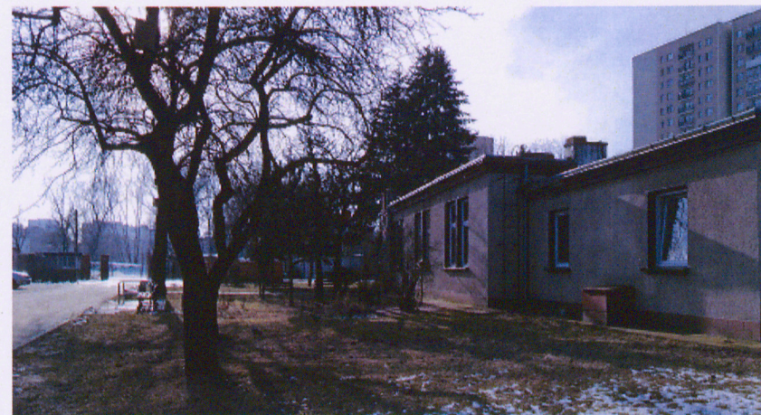
Dyrekcja osiedla, widok od strony północnej