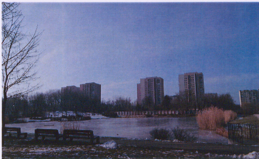
Widok na staw 2 od strony zachodniej