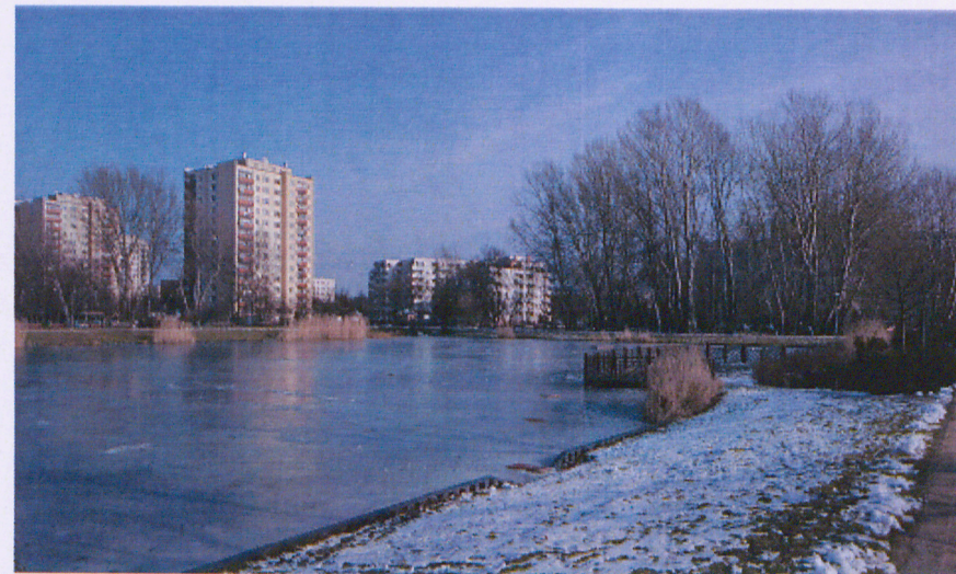
Widok na staw 2 od południa