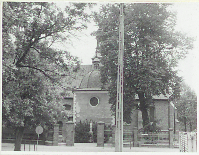
zespół kościelny od pd.