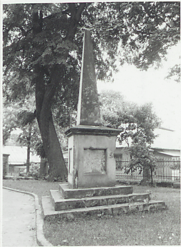
nagrobek na d.cmentarzu przykościelnym