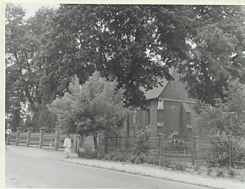
widok na zespół od pd.-wsch.