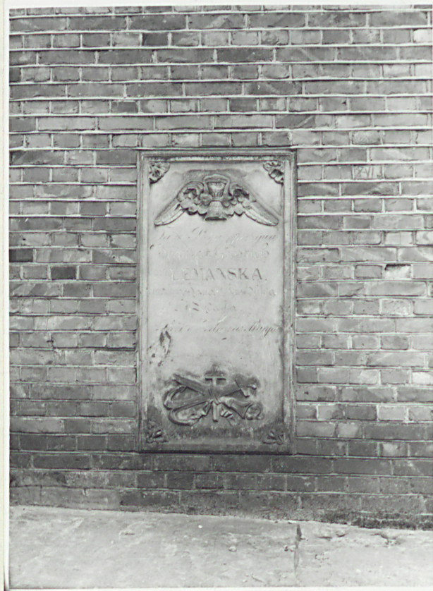
płyta nagrona w ścianie wieży