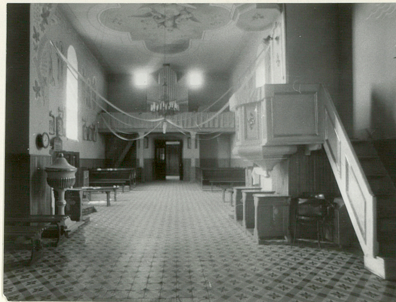
7. Wnętrze - widok w kierunku prezbiterium.