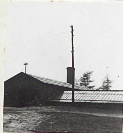
data wykonania 1976 miejsce przechowywania negatywów