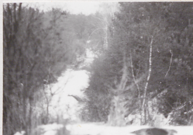
Fort VII. Widok z mostu na jez. pld. barier.

Jedn. Wyd. Akcyd. Olsztyn zam. 1299/5/78 OZGraf. ZP. Ostroda zam. 1040 n. 20000