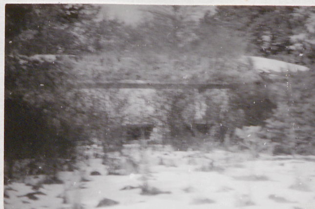
Fort VII. Trakt do karabinu płu. Widok od zach.