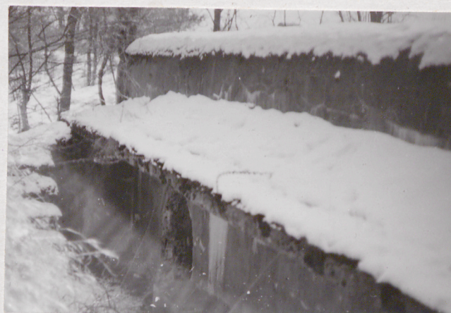
Fort VII. Kaponiera ciotowa - przelotnia na zapleczu koszar. Widok od półn. wsch.