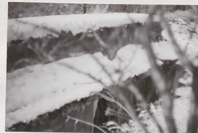
Fort VII. Kaponiera ciotowa - przelotnia na zapleczu koszar. Widok od półn. wsch.

Wkładkę założył: mgr L. Jaszewski 15 III 1987r. (imię, nazwisko, data)