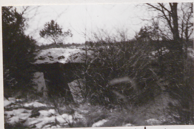
Fort VII. Stronę pogotowia. Widok od zach.