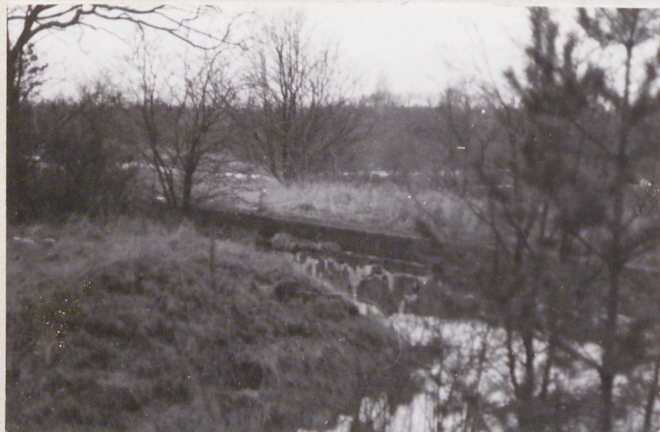
Fort VII. Widok na przedpiersie betonowe dla pieszoty i pld. barier.

Wkładkę założył: mgr L. Jaszewski 15. III. 1987r. (imię, nazwisko, data)