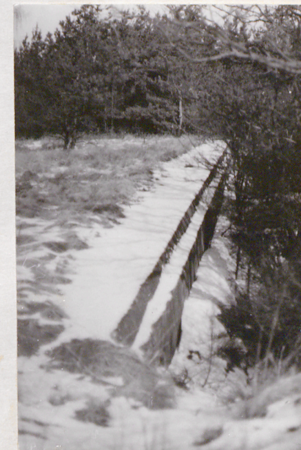
Fort VII. Widok na przedpiersie betonowe dla pieszoty i barier pld.