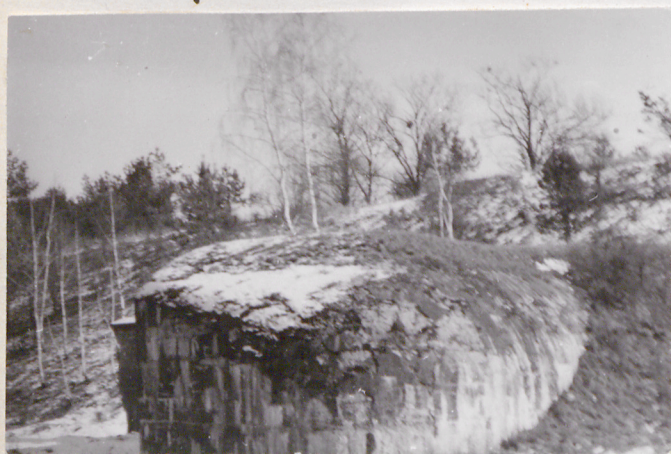
Fort VII. Kaponiera okrągła pól. baterii. Widok od zach.