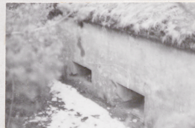
Fort VII. Trakt do karabinu płu. Widok od zach.

Wkładkę założył: mgr L. Jaszewski 15 III 1987r. (imię, nazwisko, data)