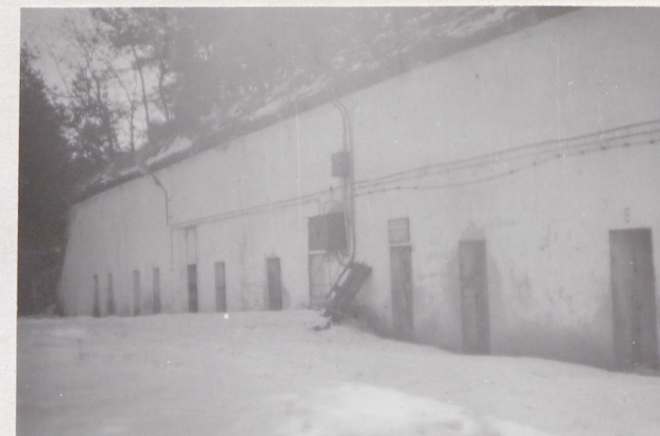
Fort VII. Koszary myjarskie. Widok od półn.