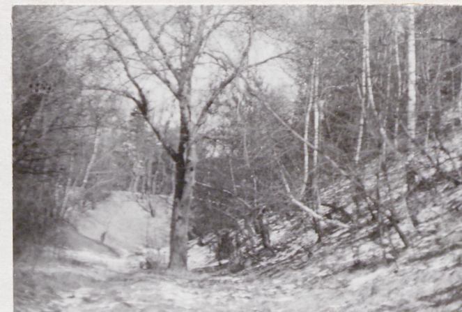
Fort VII. Widok na jez. pld. barier.