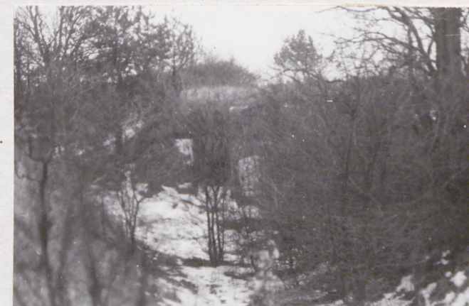
Fort VII. Stronę pogotowia. Widok od zach.