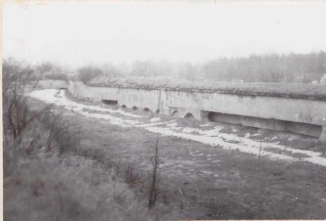
Fort VII. Widok na fosę ciotę, palisadę kaponierską - nową i kaponierę przeciwlotnicową pól. baterii. Widok od półn.