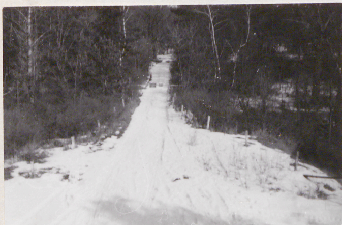
Fort VII. Droga do fortu. Widok od zach.