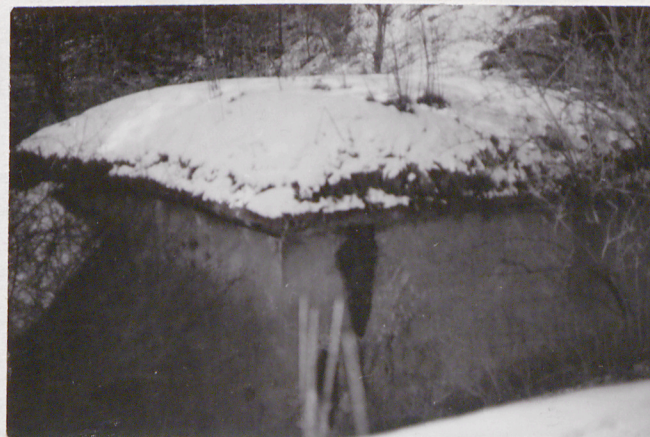
Fort VII. Budynek węża do karabinu płu. Widok od zach.