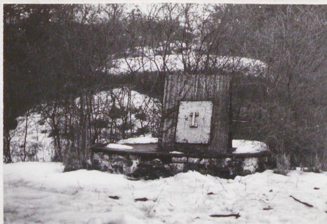
Fort VII. Studnia.