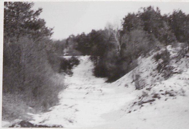
Fort VII. Widok na jez. pld. barier.