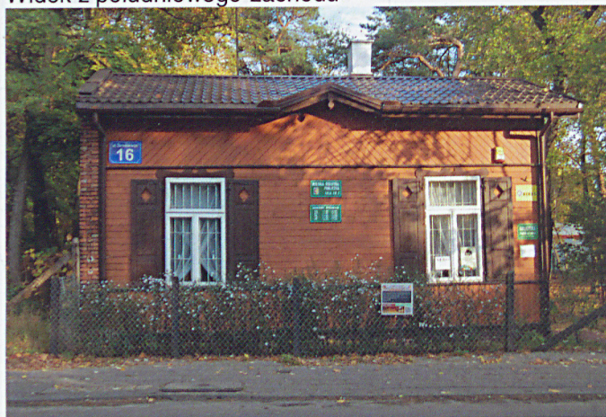
Widok z zachodu