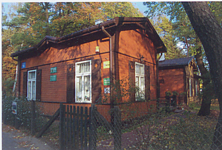
Widok z południowo-zachodu