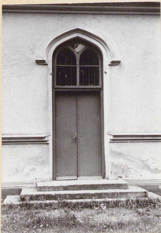
Fot. 4 Wejście w płn.-ścianie