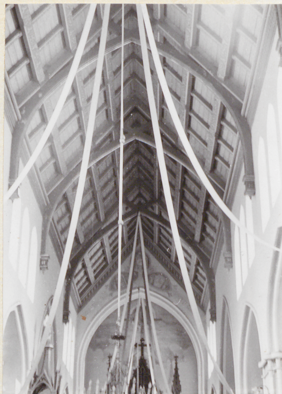
Fot. 5 Fragment więźby