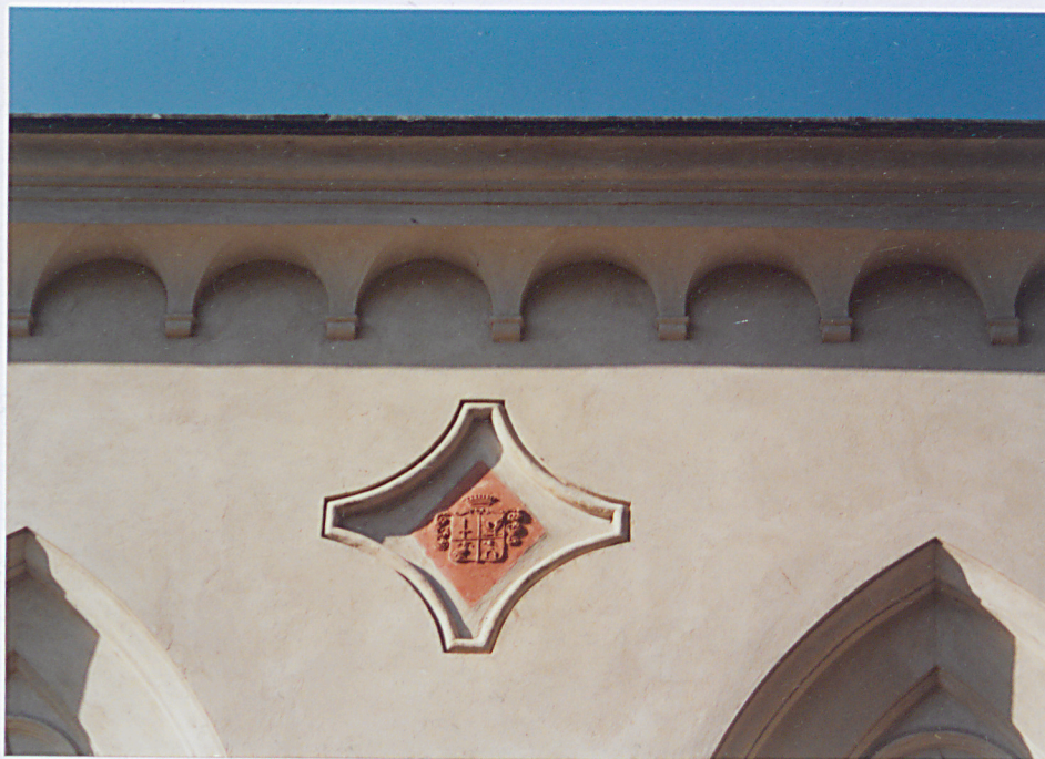
6. Płycina w elewacji zachodniej.