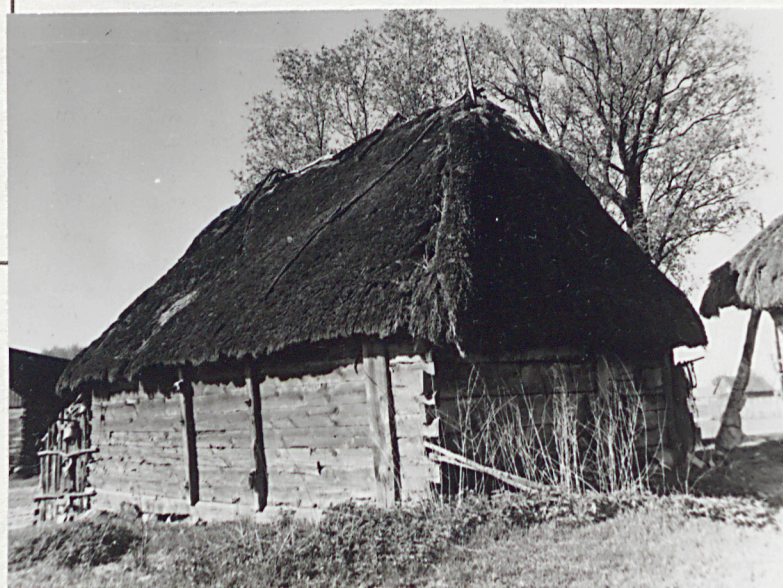
Widok od płn.-wsch.

20. Najpilniejsze postulaty konserwatorskie