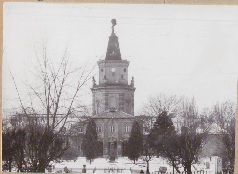
Jedn. PWi Olsztyn, z. 7014/S

rozwiązany na planie wydłużonego prostokąta o trzynastoosiowych elewacjach podłużnych i siedmioosiowych elewacjach bocznych. W elewacjach podłużnych znajdują się trzy ryzality. W ryzalitach środkowych na parterze od frontu portyki na filarkach. Na osi środkowej, na rzucie okrągłego na parterze wewnątrz wznosi się bryła sześciobocznej wieży o dwu zwężających się ku górze kondygnacjach zwieńczonych szerokim obeliskiem. Na szczycie obelisku posąg brązowy Atlasa dźwigającego symbol kuli ziemskiej. Partie międzyryzalitowe gmachu przeprute są otworami dwu przejazdów przez całą głębokość. Podziały elewacji przeprowadzone są za pomocą lizen i płycin tworząc obramione pola, w których osadzone są otwory okien i drzwi. Otwory są prostokątne oraz zamknięte od góry łukiem odcinkowym. Wieża w formach klasycyzmu II poł. XVIII w. / pilastry, doryckie belkowanie zakończenia wieży, wazowa balustrada obejścia, gzyms i narożne bonie /