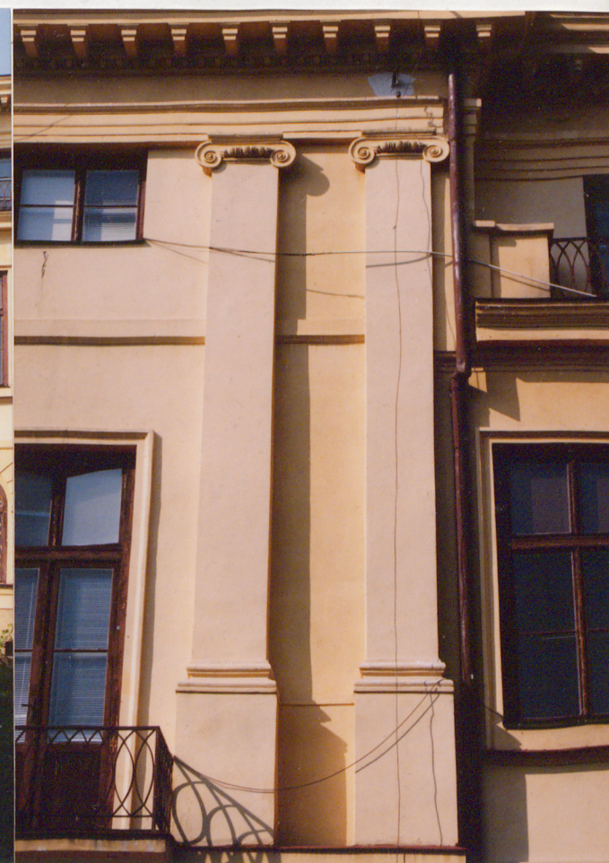
MIŃSK MAZOWIEC PAŁAC