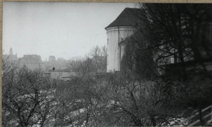
WIDOK NA TEREN CMENTARZA OD STRONY KRAWĘDZI SKARPY PRZY UL. KOŚCIELNEJ W GŁĘBI KOŚCIÓŁ ŚW. BENONA