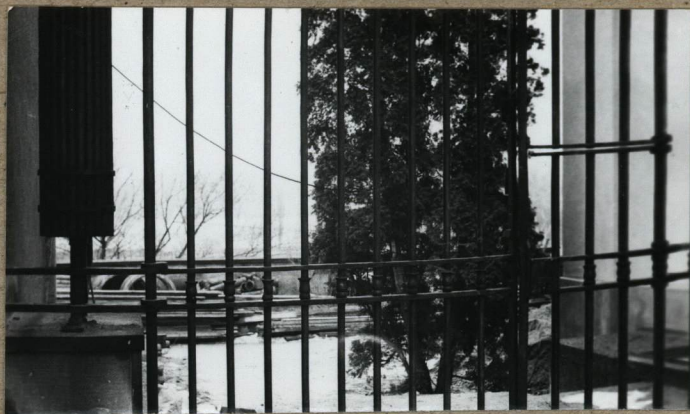
WIDOK NA TEREN CMENTARZA PRZECZ BRAMĘ PRZYKOŚCIELNĄ OD STRONY UL. PIESZEJ