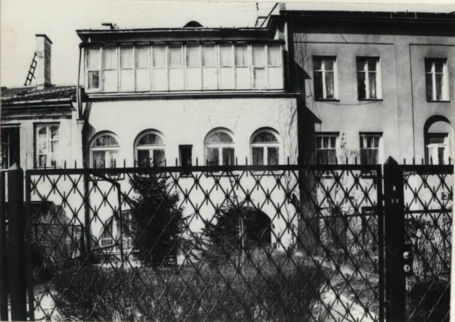
FASADA /ELEWACJA ZACH./