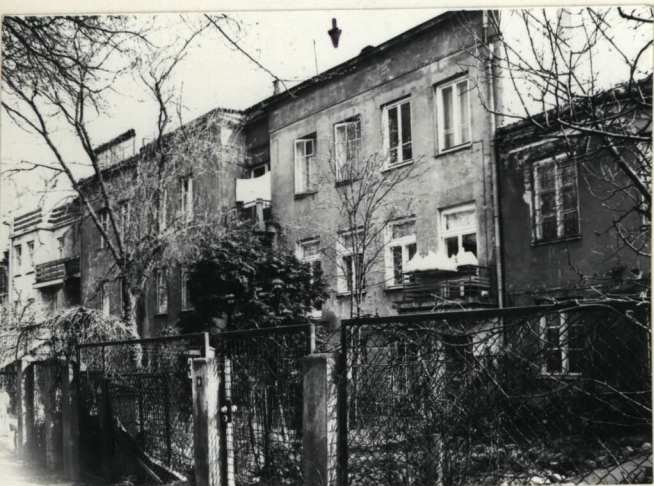
ELEWACJA TYLNA /WSCH./

4. Adres ul. Zakopiańska 35 nr hipoteczny 2003 Pr