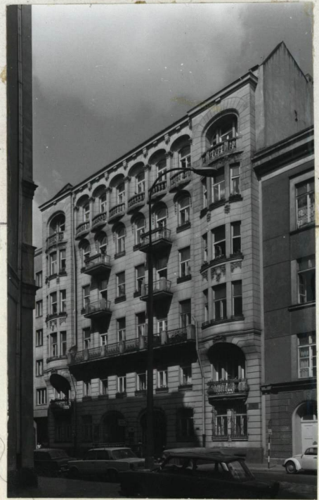
FASADA - WIDOK OO PN-WSCHODU