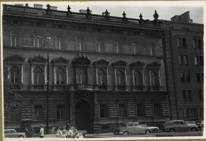
S. Łoza - Architekti i Budownictwie w Polsce, 1954