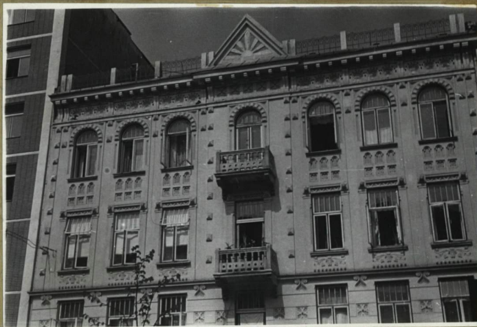
Lore St. - Architektura i budownictwo w Polsce, 1954 "Architekt" 1907, nr. 2