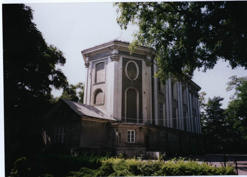
4. widok od str. prezbiterium