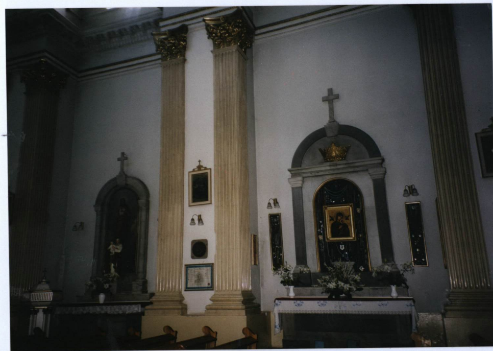
4. ściana południowa