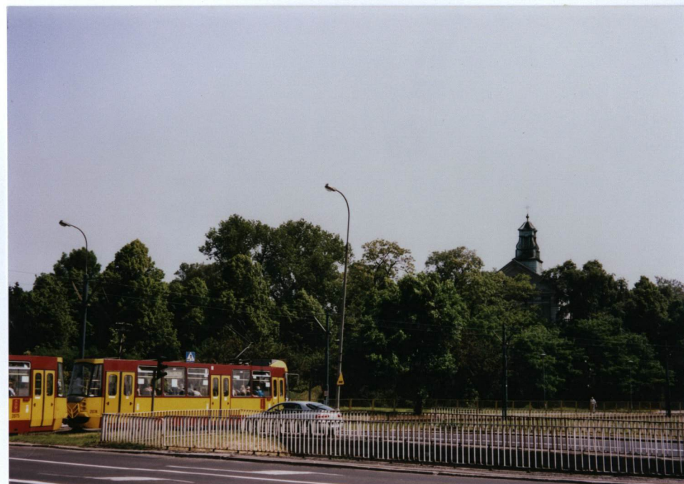
2. Widok na kościół i Redutę Wolską u zbiegu ul. Wolskiej i Redutowej