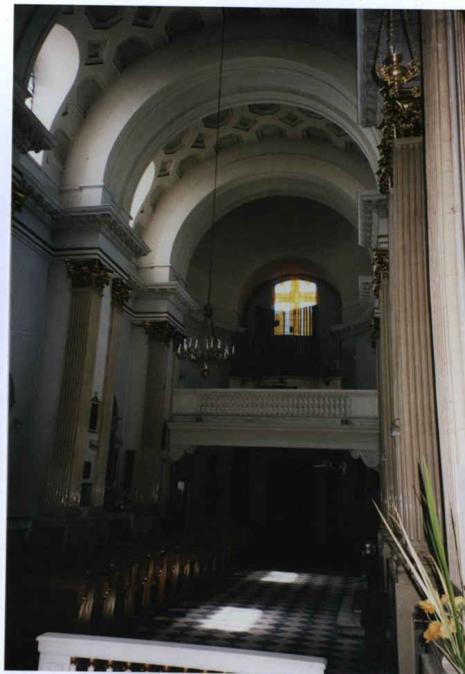
2. widok w kierunku zachodnim na chór muzyczny