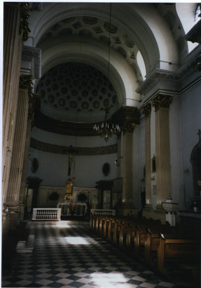
1. widok w kierunku wschodnim na prezbiterium