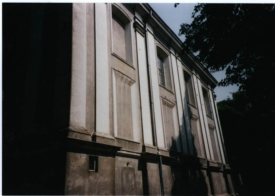
1. Elewacja południowa