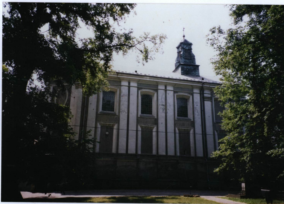
3. Elewacja północna