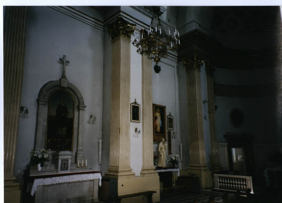
3. ściana północna