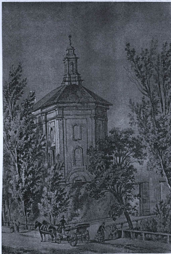
kościół, przebudowany na cerkiew M. B. Włodzimierskiej, (Adam Idzikowski 1838)

Kościół św. Wawrzyńca na Woli jest szczególnym obiektem zabytkowym łączącym w sobie wartości jako miejsca szczególnych walk, represji i propagandy, oraz dzieła architektury i budownictwa, którego mury kształtowane były od końca XVII w.