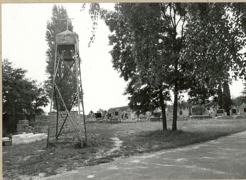
2. WIDOK OD WEJŚCIA - DRWONICA