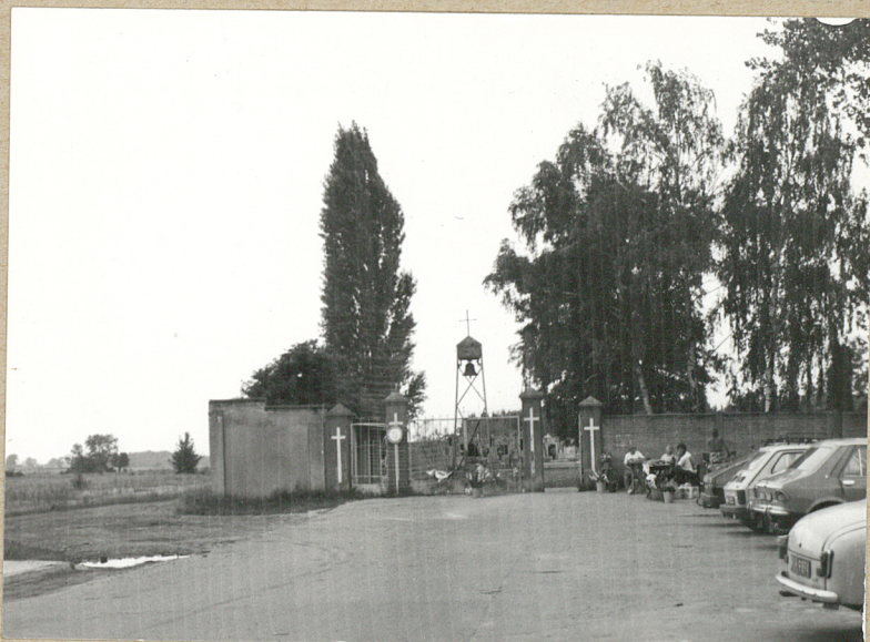
1. BRAMA GŁÓWNA