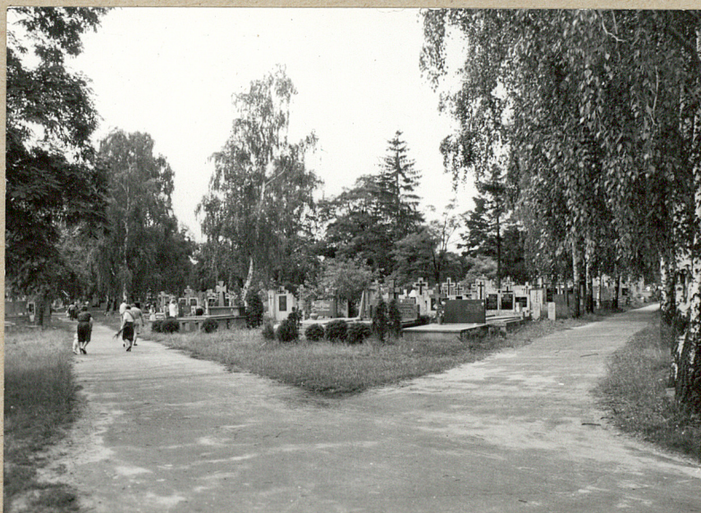
3. ALEJE OD WEJŚCIA