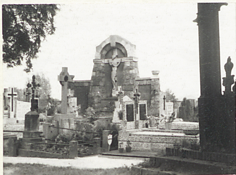
1905. GROB GLEZMERÓW