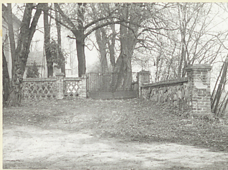
WJAZD DO CMENTARZA