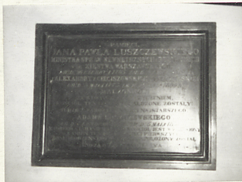
ok 1853. J.P. ŁUSZCZEWSKI