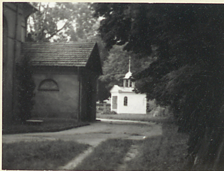
TEREN PRZY KOŚCIELNY