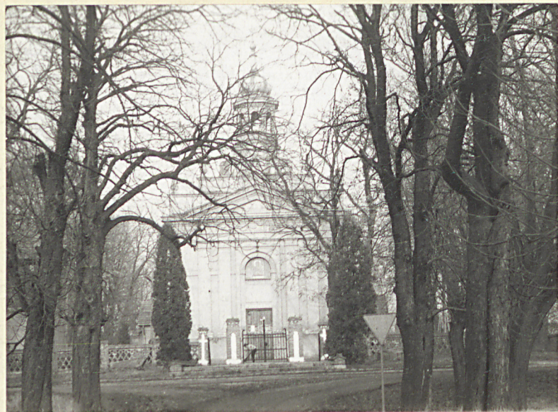
KOŚCIÓŁ p.n.w. XIX w.