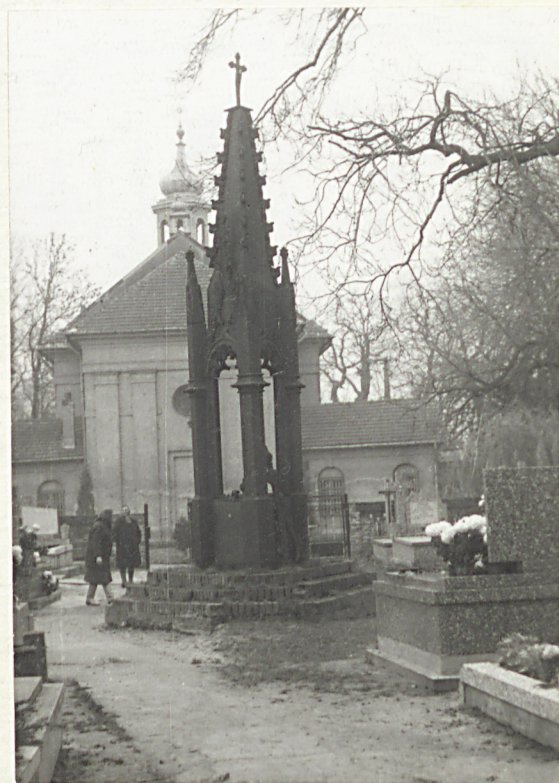
NAGROBEK I EPITAFIUM 1856. H. SŁEWIŃSKA