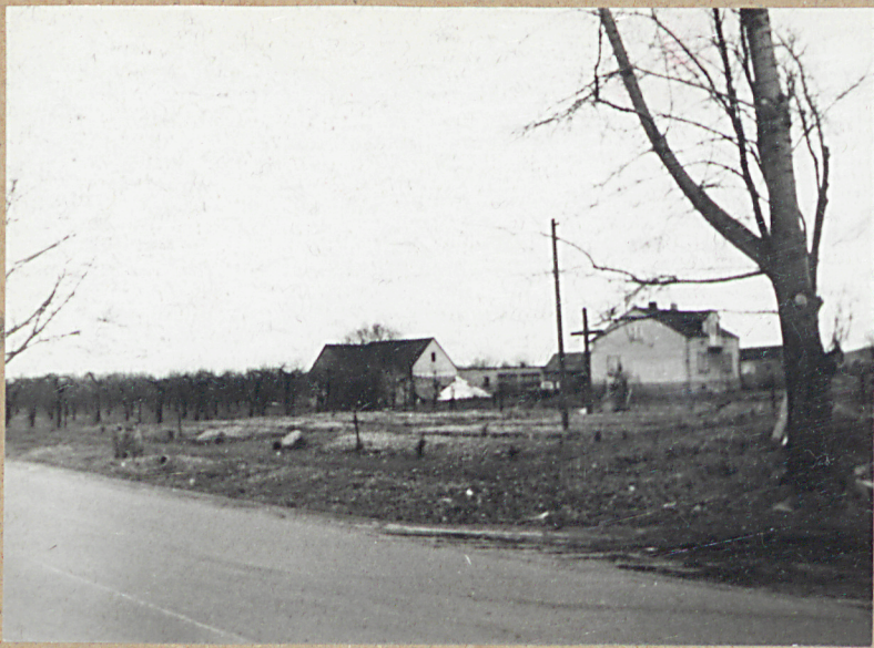
1. Cmentarz odd strony drogi