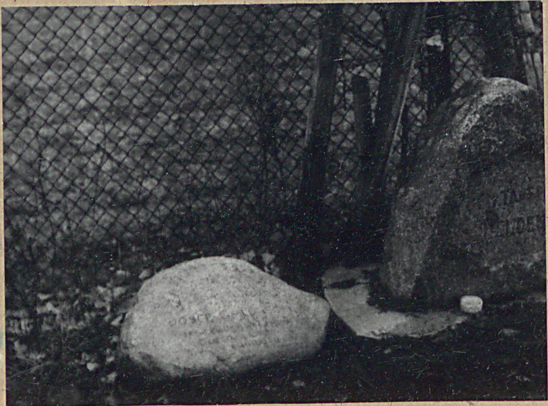
2. z prawej strony obelisku z napisem DEN TAPPEREN HELDEN - WALECZNYM BOHATEROM