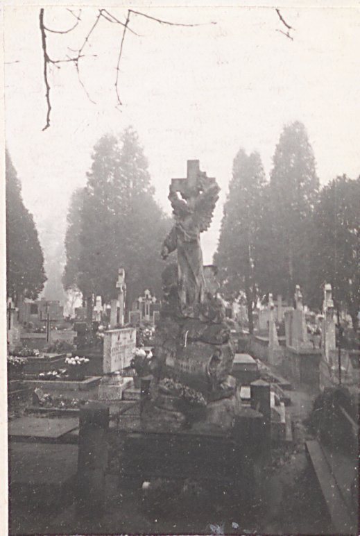
FOT. 8 - POMNIK JZABELY Z LUBEKÓW RADOMYSKIEJ ZM. 1902 R.