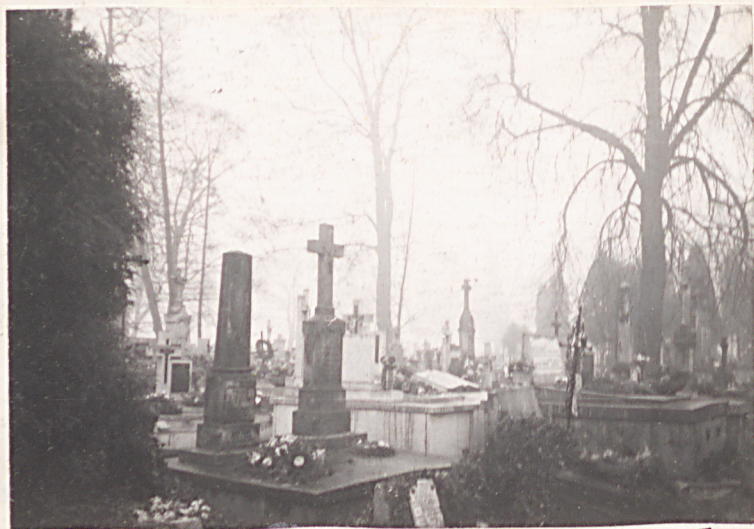
FOT. 9 - OGÓLNY WIDOK PD-WSCHODNIEJ CZĘŚCI CMENTARZA