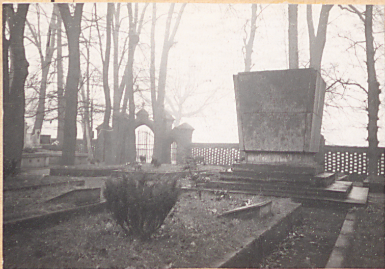
FOT. 5 - POMNIK KU CZCI ŻOŁNIERZY RADZIECKICH POLESŁYCH W 1945 R.