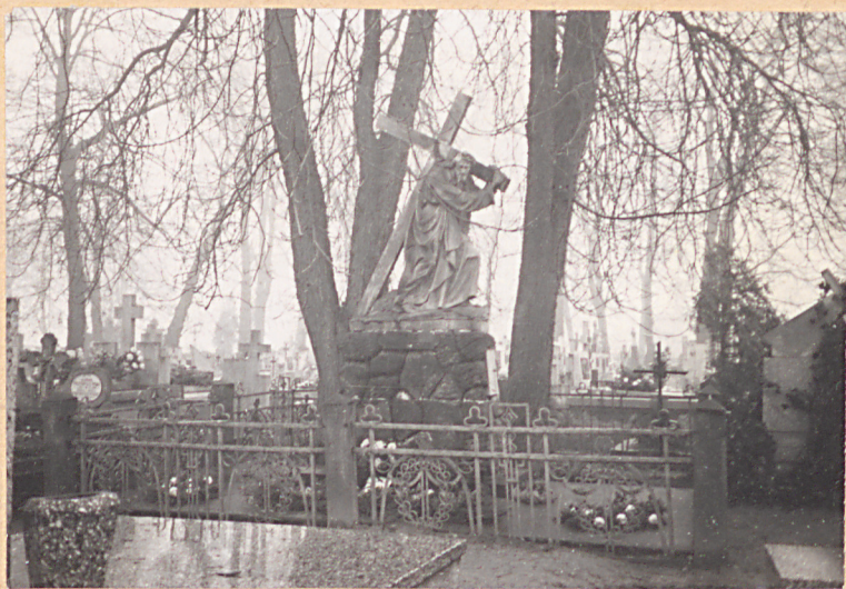
FOT. 4 - POMNIK NA GROBIE RODZINY PEHLKÓW (1897, 1902, 1916)