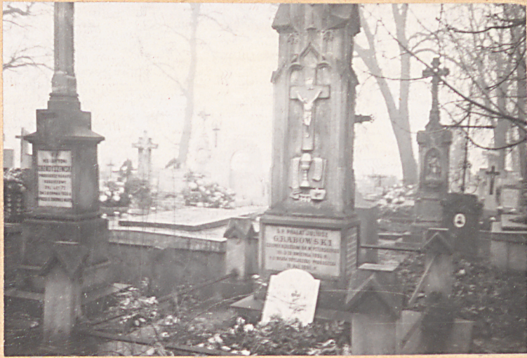
FOT. 2 - NAGROBEK KS. PRAŁATA JULIUSZA GRABOWSKIEGO Z M. 1886 R.