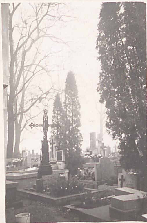
FOT. 12 - ŻELIWNY KRZYŻ NA GROBIE DOMINIK KOREWY ZM 1868 R.