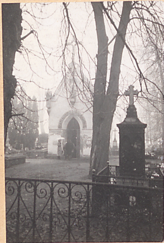
FOT. 3 - TEREN CMENTARZA W OKOLICY KAPLICY Z NAJ- STARSZYMI NAGROBKAMI