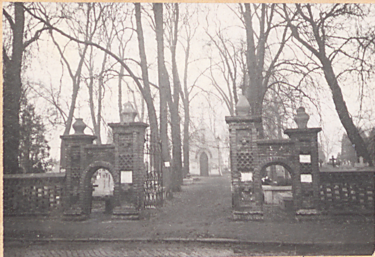
FOT. 1 - BRAMA Z KAPLICĄ CMENTARNA NA OSI AL. KASZTAŃOWEJ