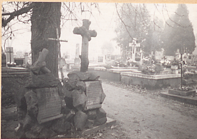
FOT. 6 - POMNIKI J. i Z. FEIST. (1891 i 1896)