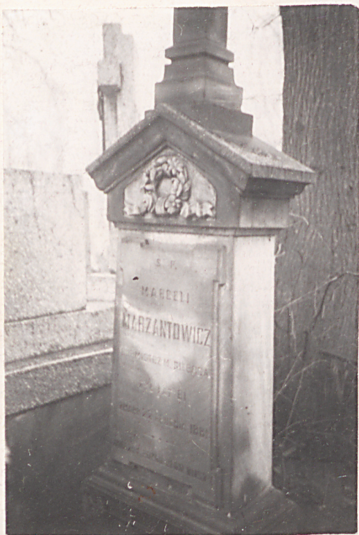
FOT. 11 - DOMNIK MARCELEGO MARZANTOWSKIEGO BURMISTRZA SIERPCA ZM 1881 R.