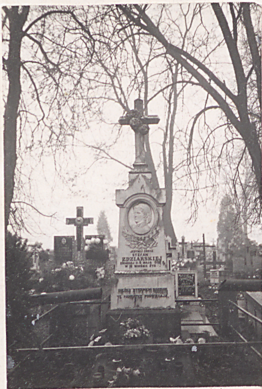
FOT. 7 - POMNIK STEFANII ZDZIARSKIEJ ZM. 1882 R. PIERWOWZORU POWIEŚCI „TRĘDOWATA”