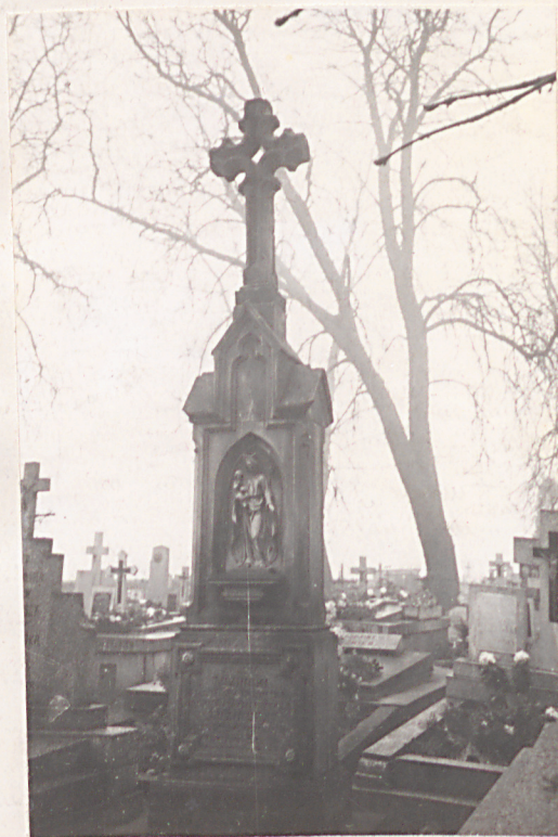
FOT. 10 - POMNIK MAEZONKÓW TUZIŃSKICH.