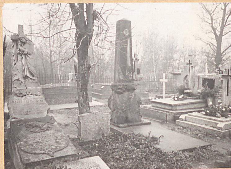
FOT.6- CENNE NAGROBK I Z POCZ. XXW.