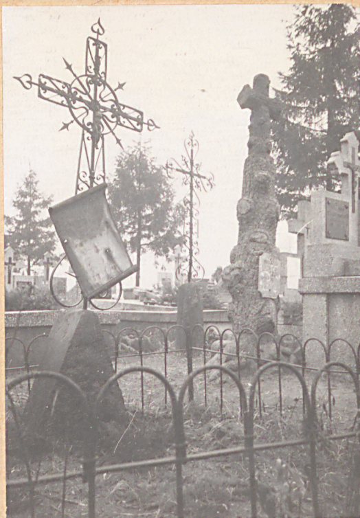
FOT.2- FRAGMENT PN-ZACH CZĘŚCI CMENTARZA Z NAGROB- KAMI Z I POK XXW