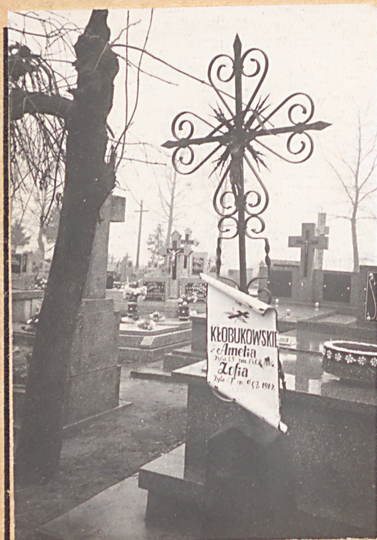
FOT.5- OGÓLNY WIDOK WSCHODNIEJ CZĘŚCI CMENTARZA