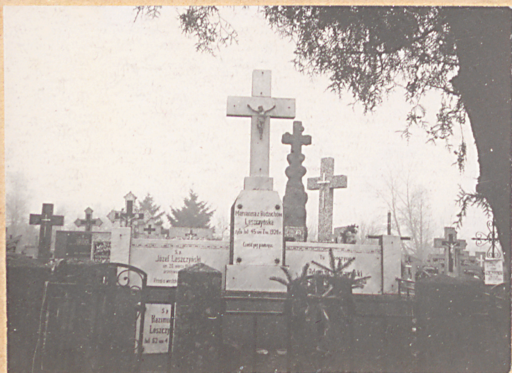
FOT.3- GROBOWIEC RODZINY ŁĘSZYŃSKICH Z 1920R