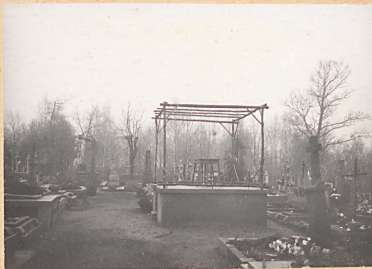
FOT.4- ULTARZ POŁONY